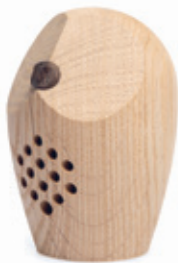
Huuri Waldklang (Art. Nr. 3050)