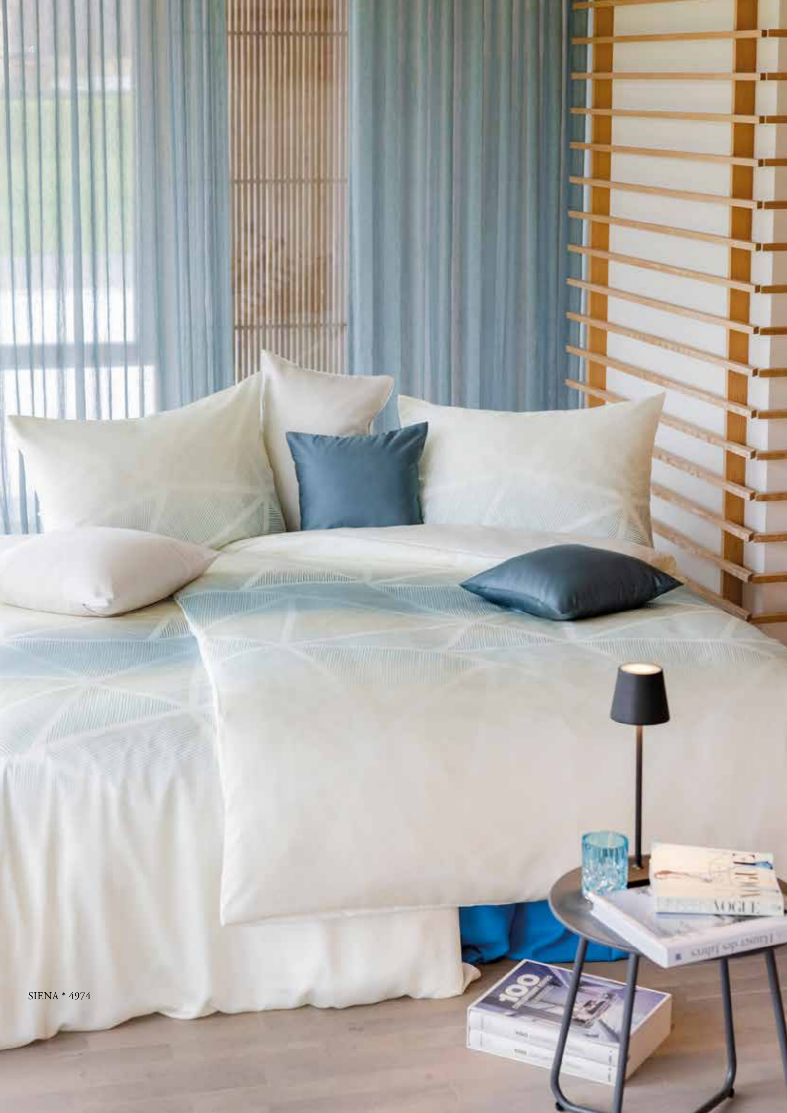
SIENA * 4974