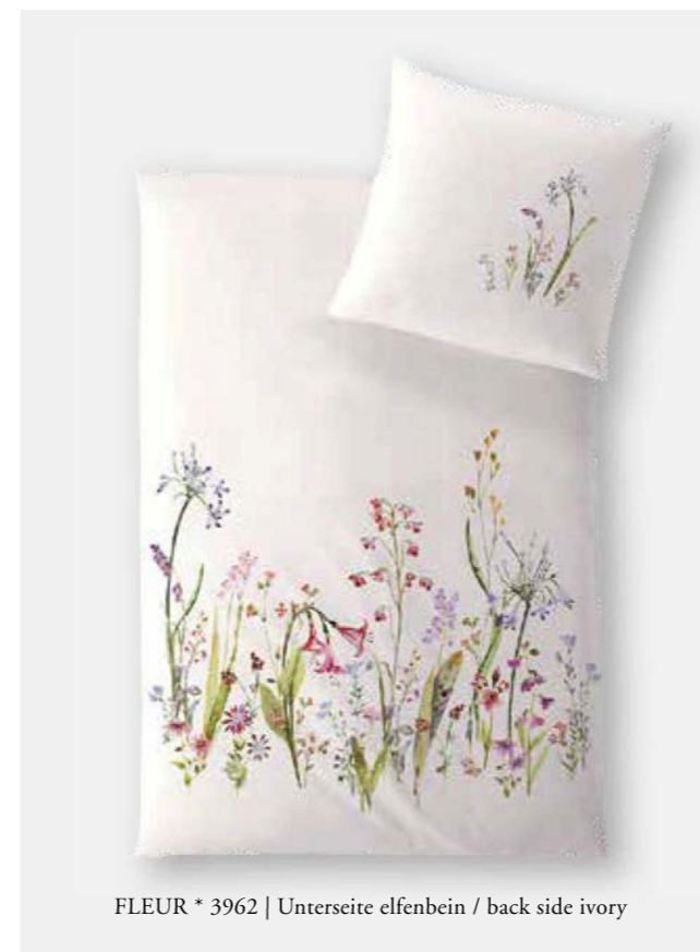
FLEUR * 3962 | Unterseite elfenbein / back side ivory