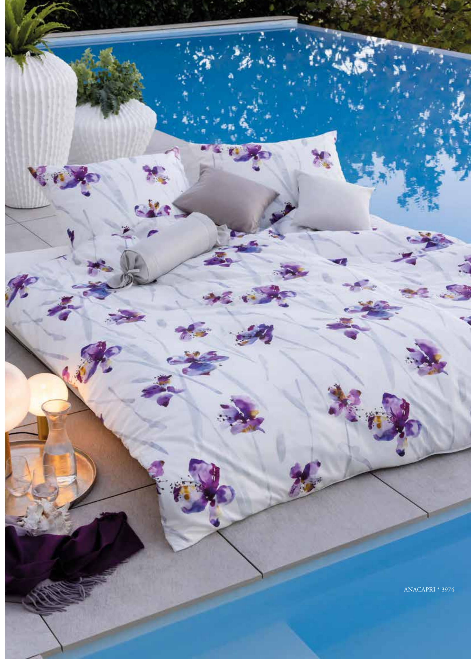
ANACAPRI * 3974