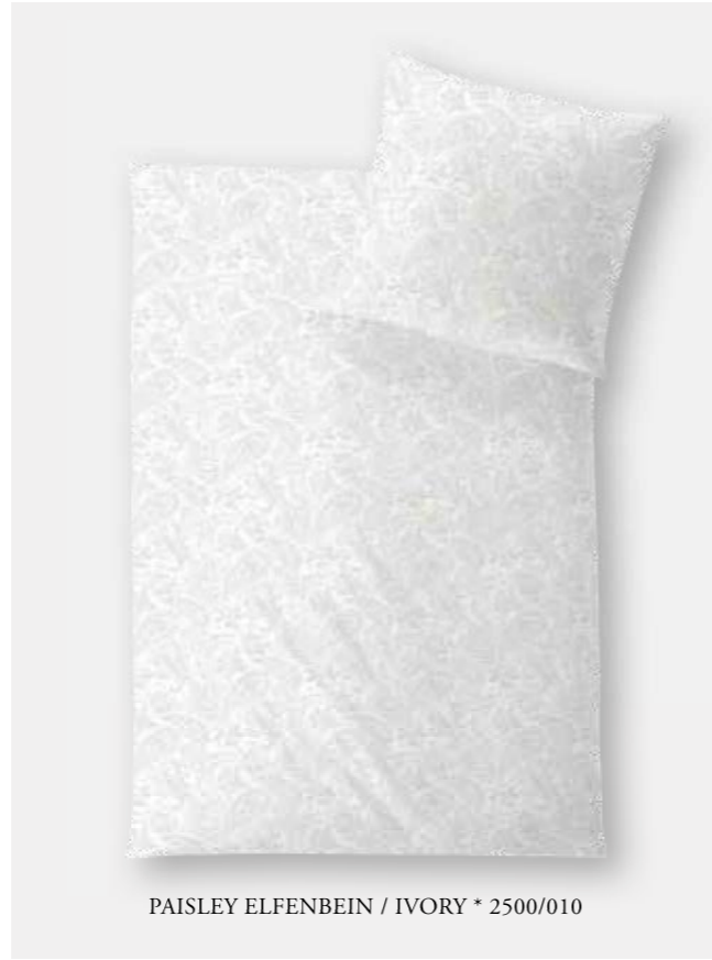
PAISLEY ELFENBEIN / IVORY * 2500/010