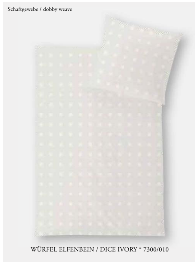
WÜRFEL ELFENBEIN / DICE IVORY * 7300/010