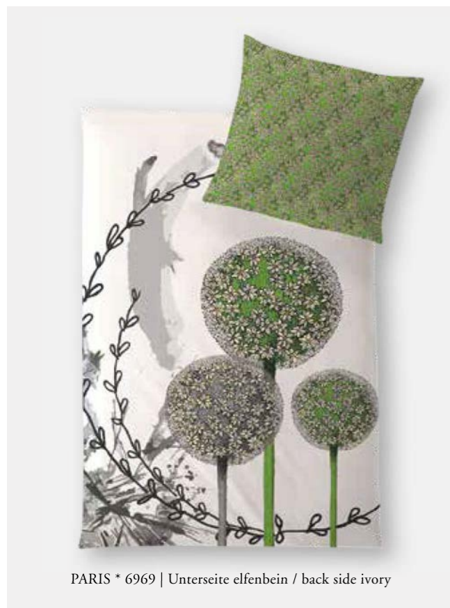
PARIS * 6969 | Unterseite elfenbein / back side ivory