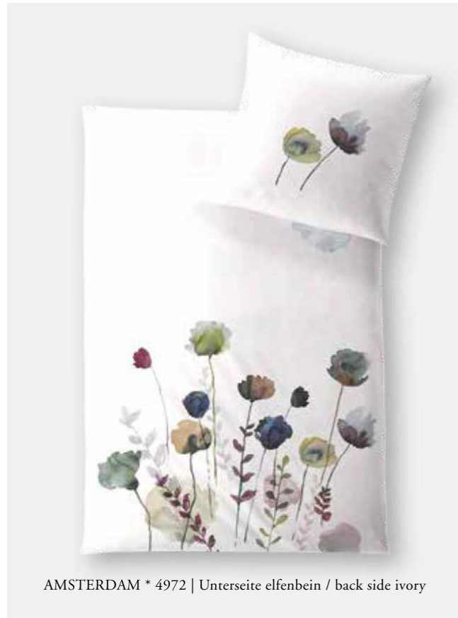
AMSTERDAM * 4972 | Unterseite elfenbein / back side ivory