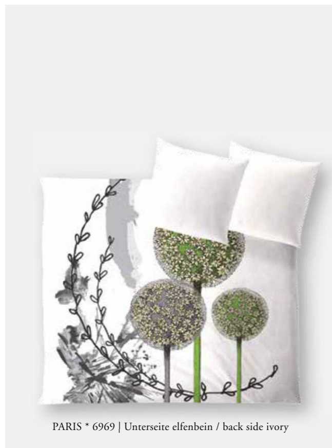
PARIS * 6969 | Unterseite elfenbein / back side ivory