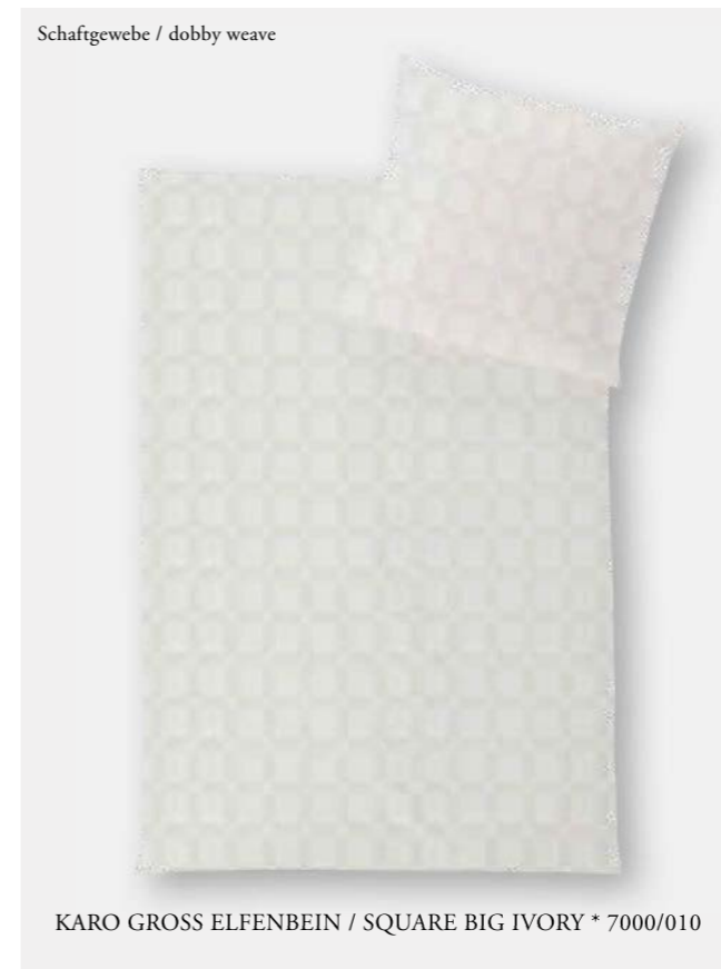
KARO GROSS ELFENBEIN / SQUARE BIG IVORY * 7000/010