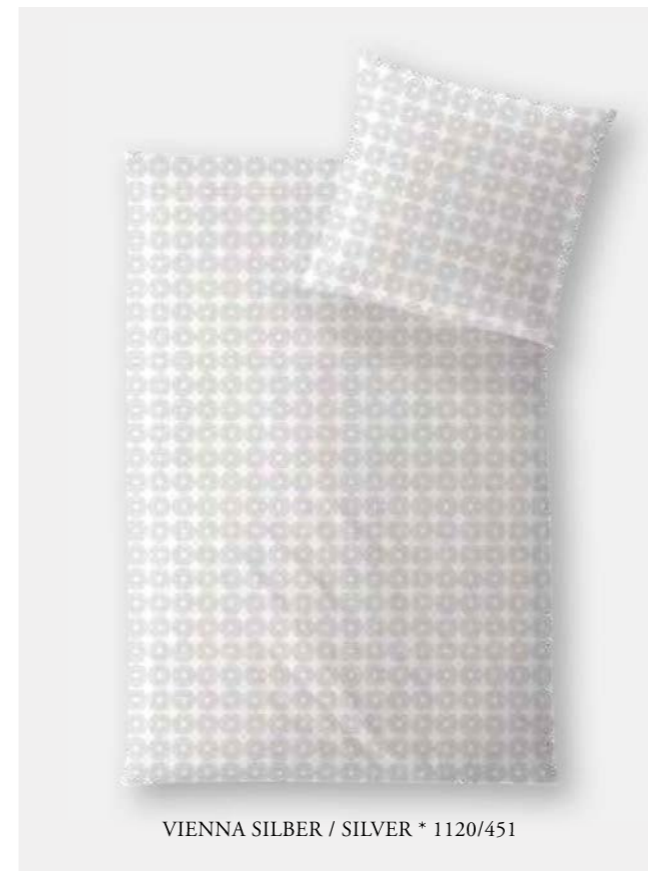
VIENNA SILBER / SILVER * 1120/451