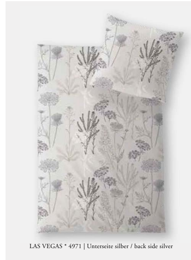
LAS VEGAS * 4971 | Unterseite silber / back side silver