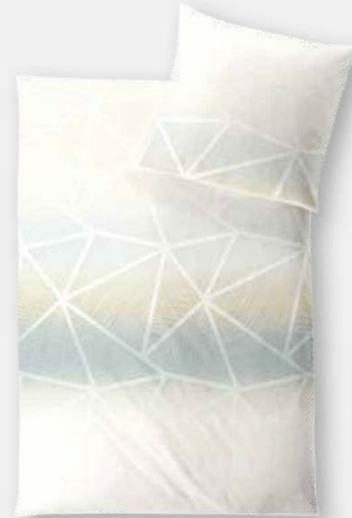
SIENA * 4974 | Unterseite elfenbein / back side ivory