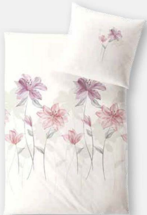
PISA * 3934 | Unterseite elfenbein / back side ivory