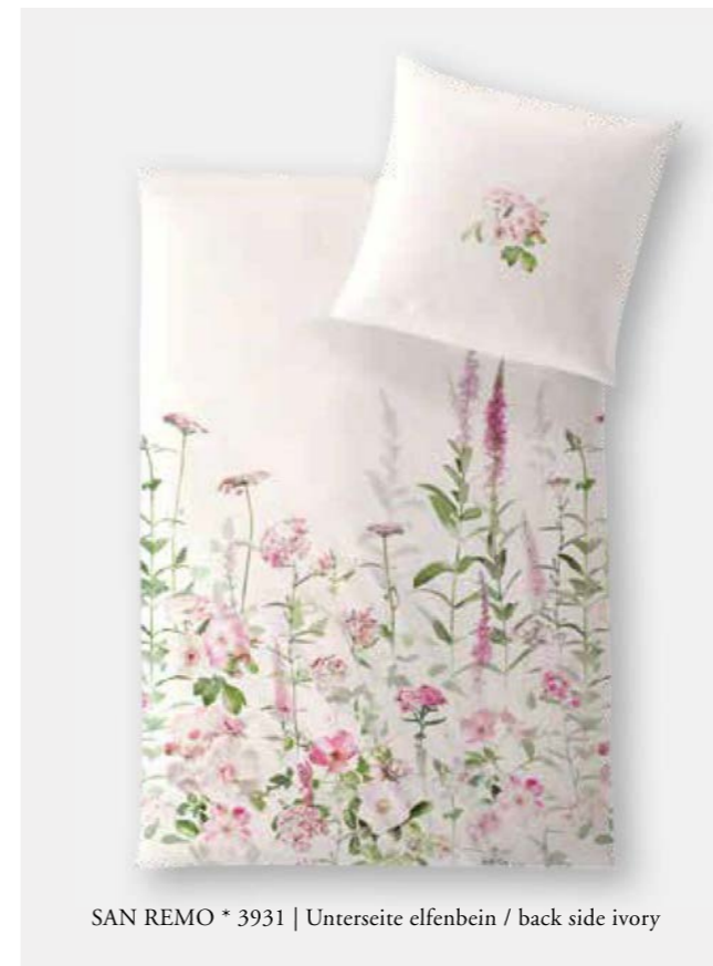
SAN REMO * 3931 | Unterseite elfenbein / back side ivory