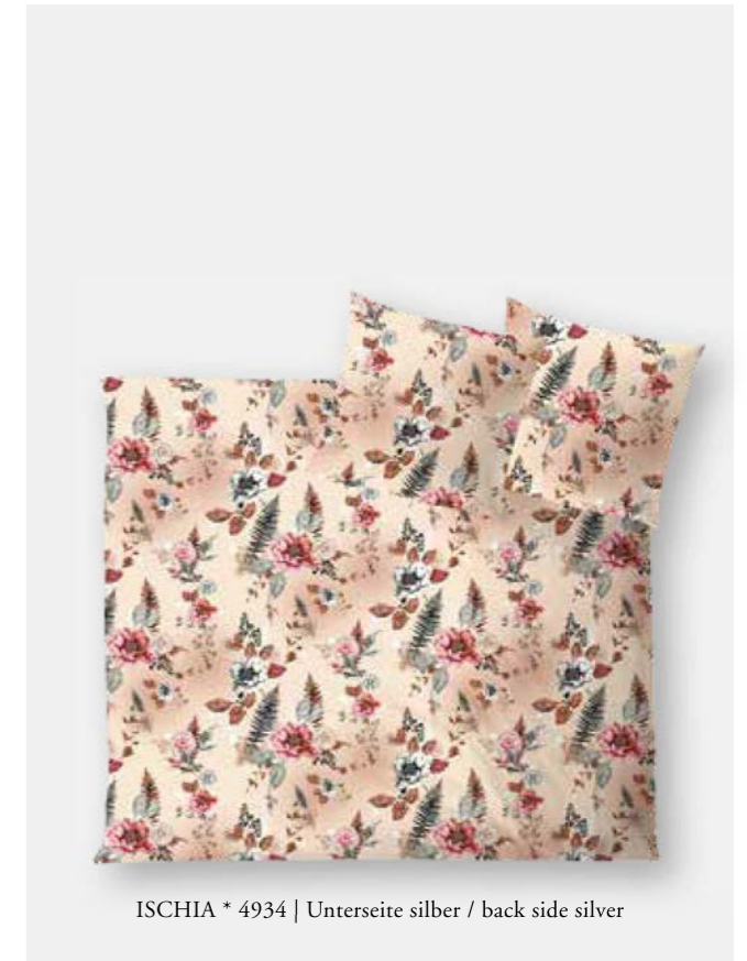
ISCHIA * 4934 | Unterseite silber / back side silver