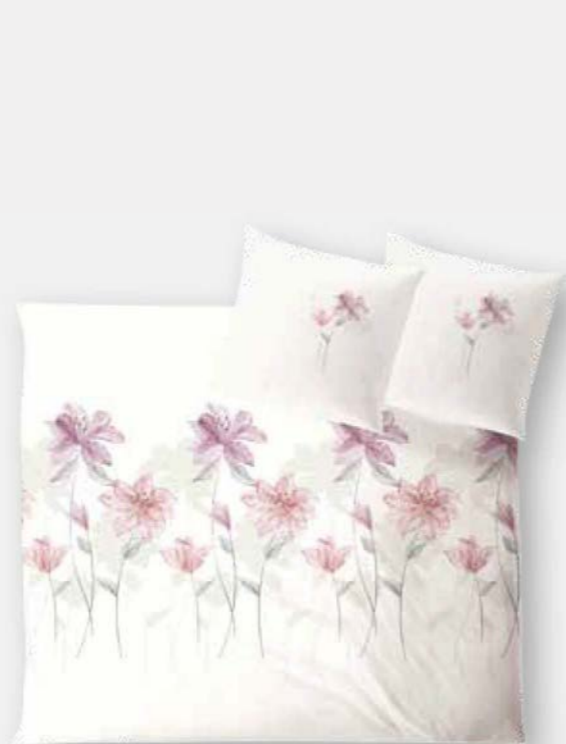
PISA * 3934 | Unterseite elfenbein / back side ivory