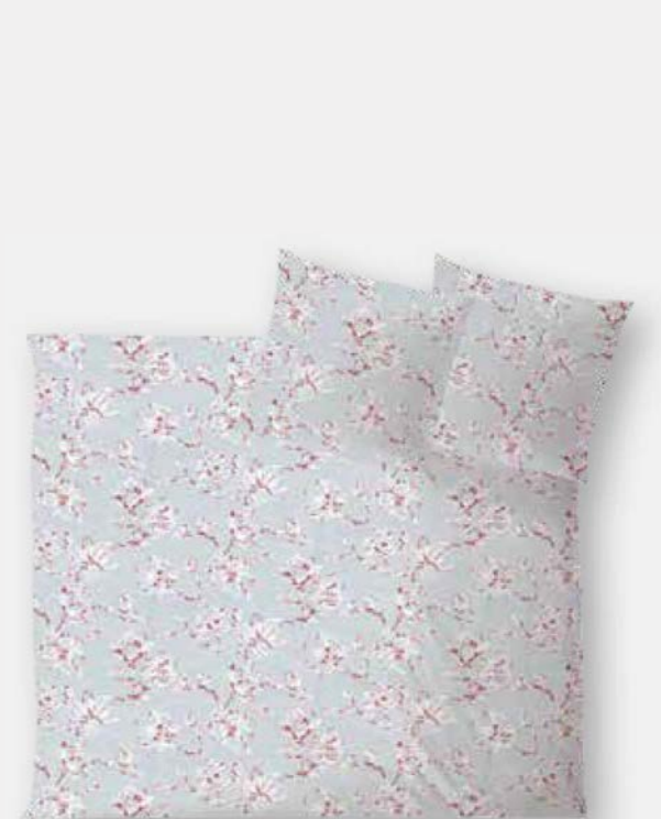
CHIANTI * 4935 | Unterseite weiß / back side white