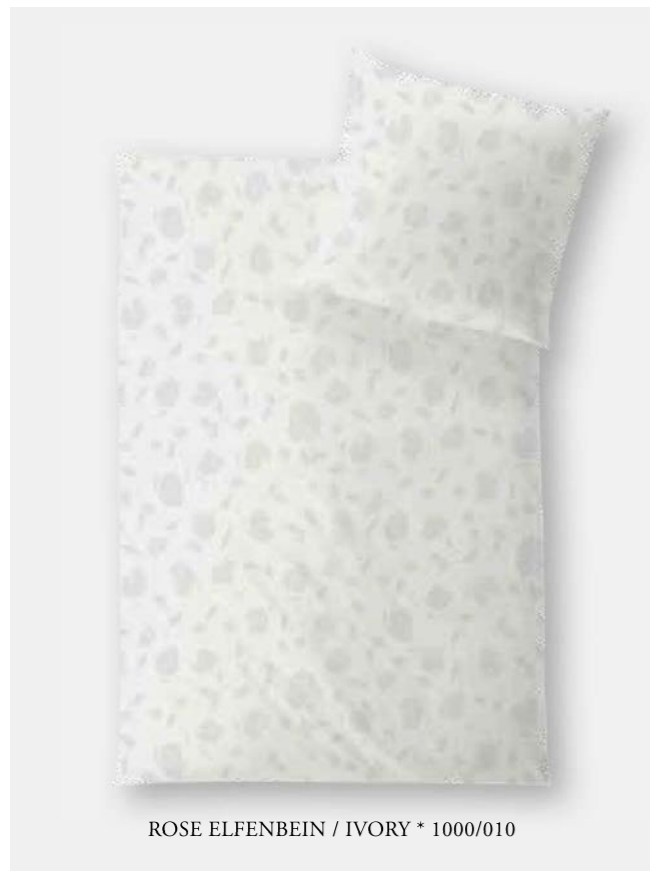
ROSE ELFENBEIN / IVORY * 1000/010