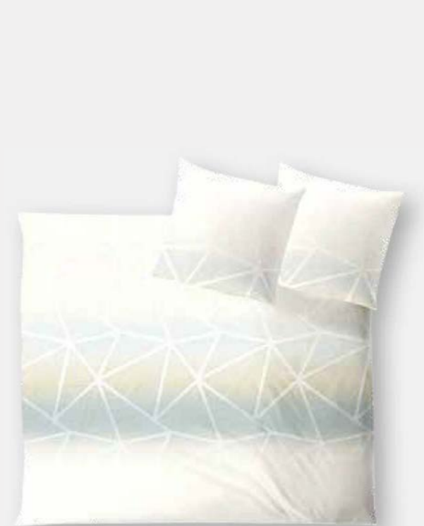
SIENA * 4974 | Unterseite elfenbein / back side ivory