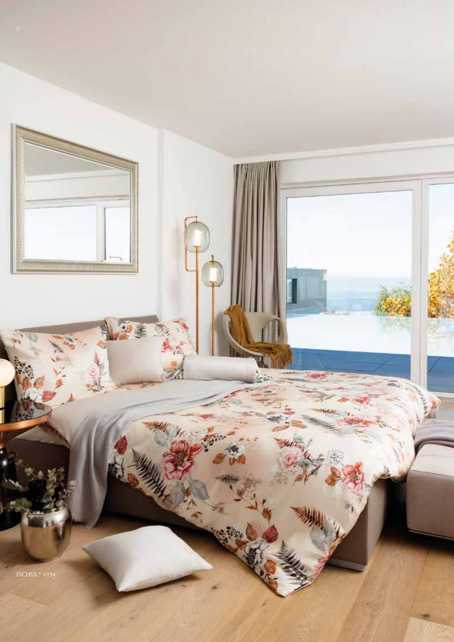
ISCHIA * 4934