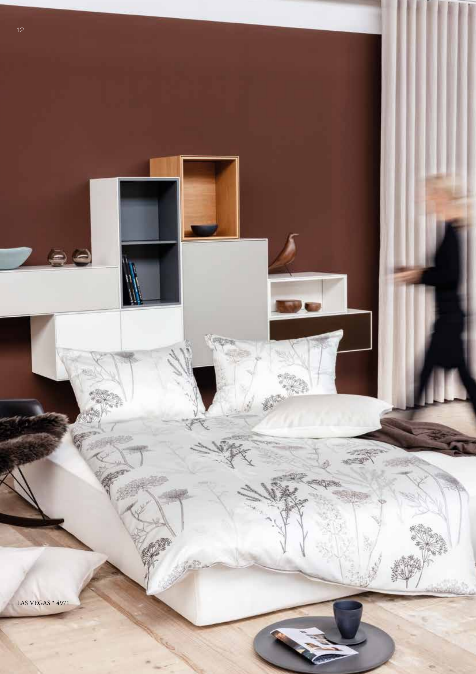
LAS VEGAS * 4971