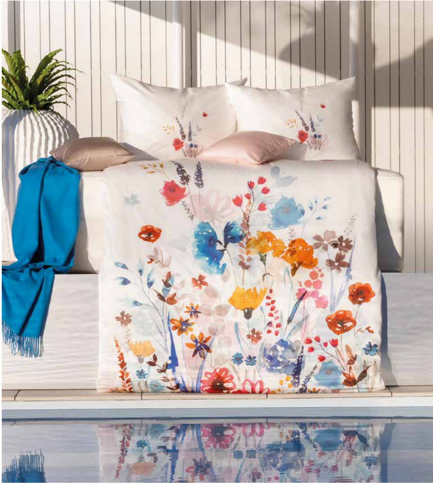
POSITANO * 5933