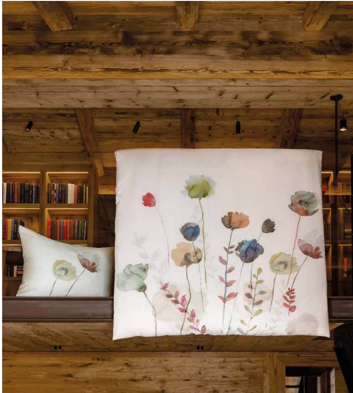
AMSTERDAM * 4972