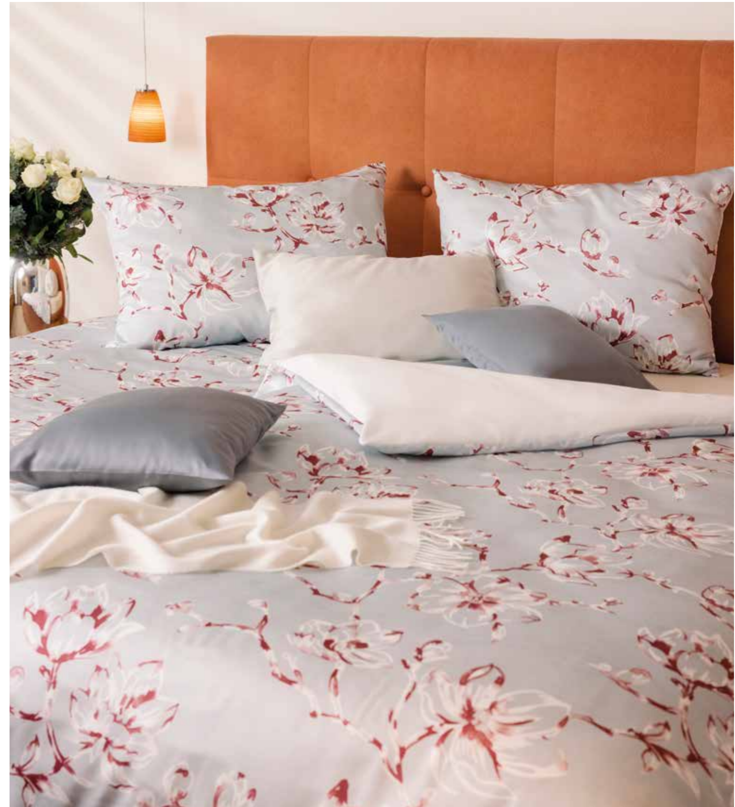
CHIANTI * 4935