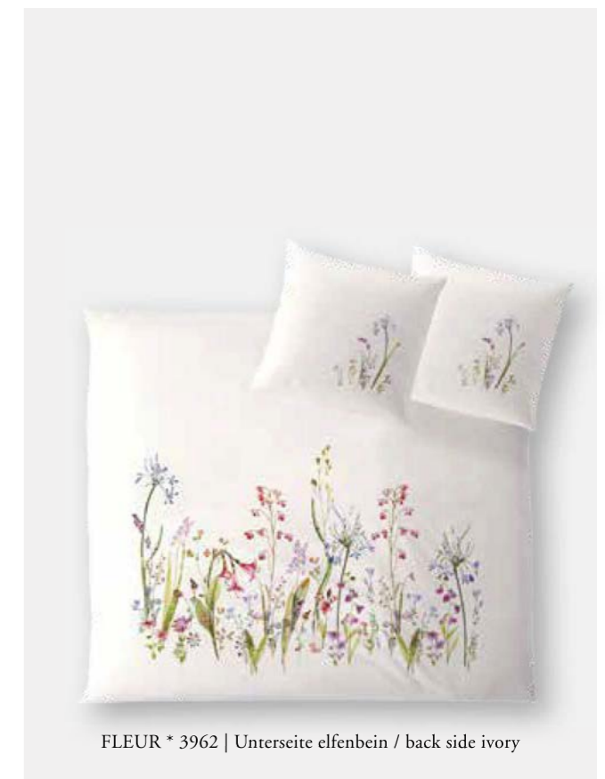
FLEUR * 3962 | Unterseite elfenbein / back side ivory

HINWEIS: Farbabweichungen zwischen Einzel- und Doppelbettbezügen sind möglich NOTE: Colour deviations between single and dual duvet covers are possible