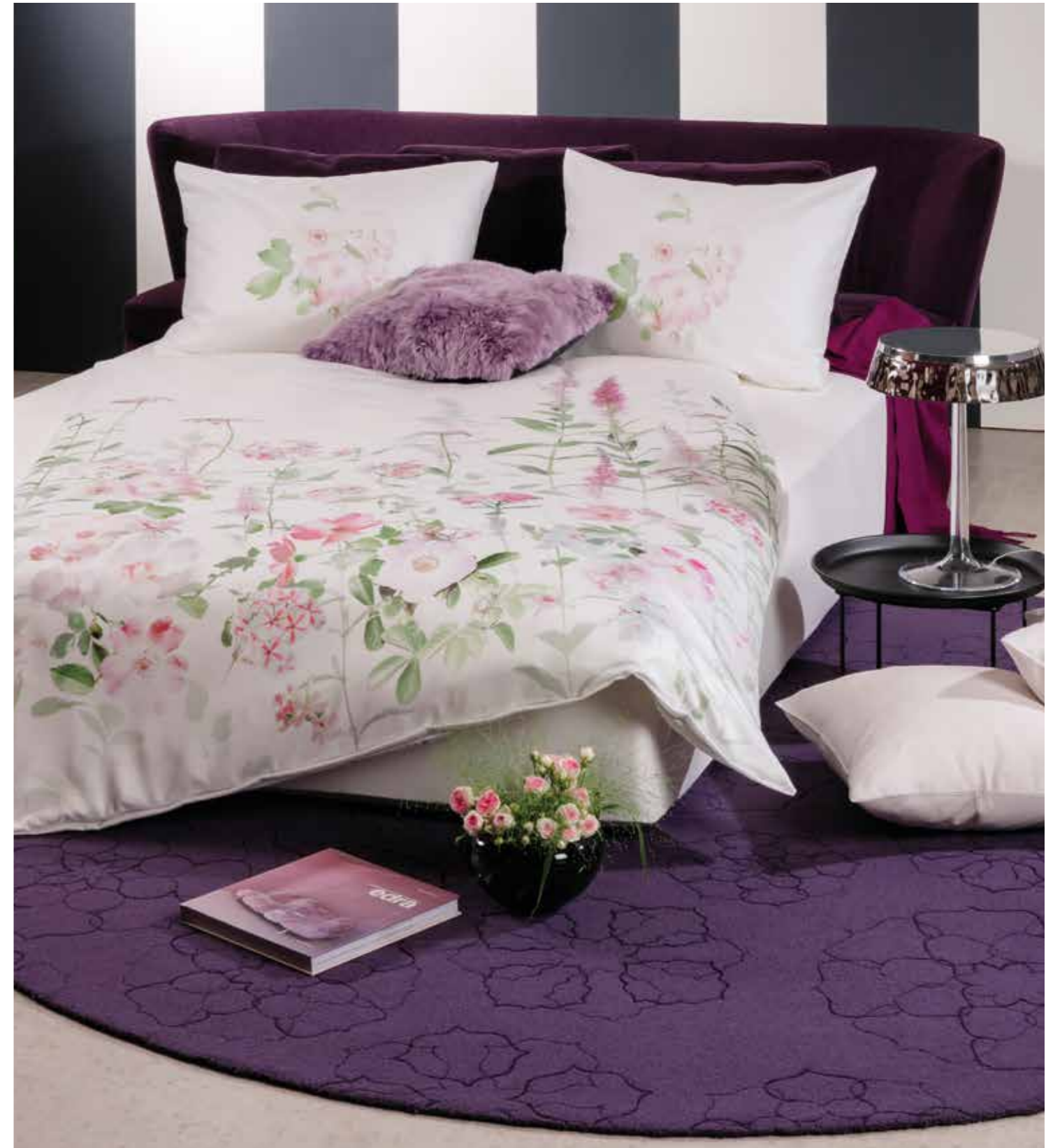
SAN REMO * 3931