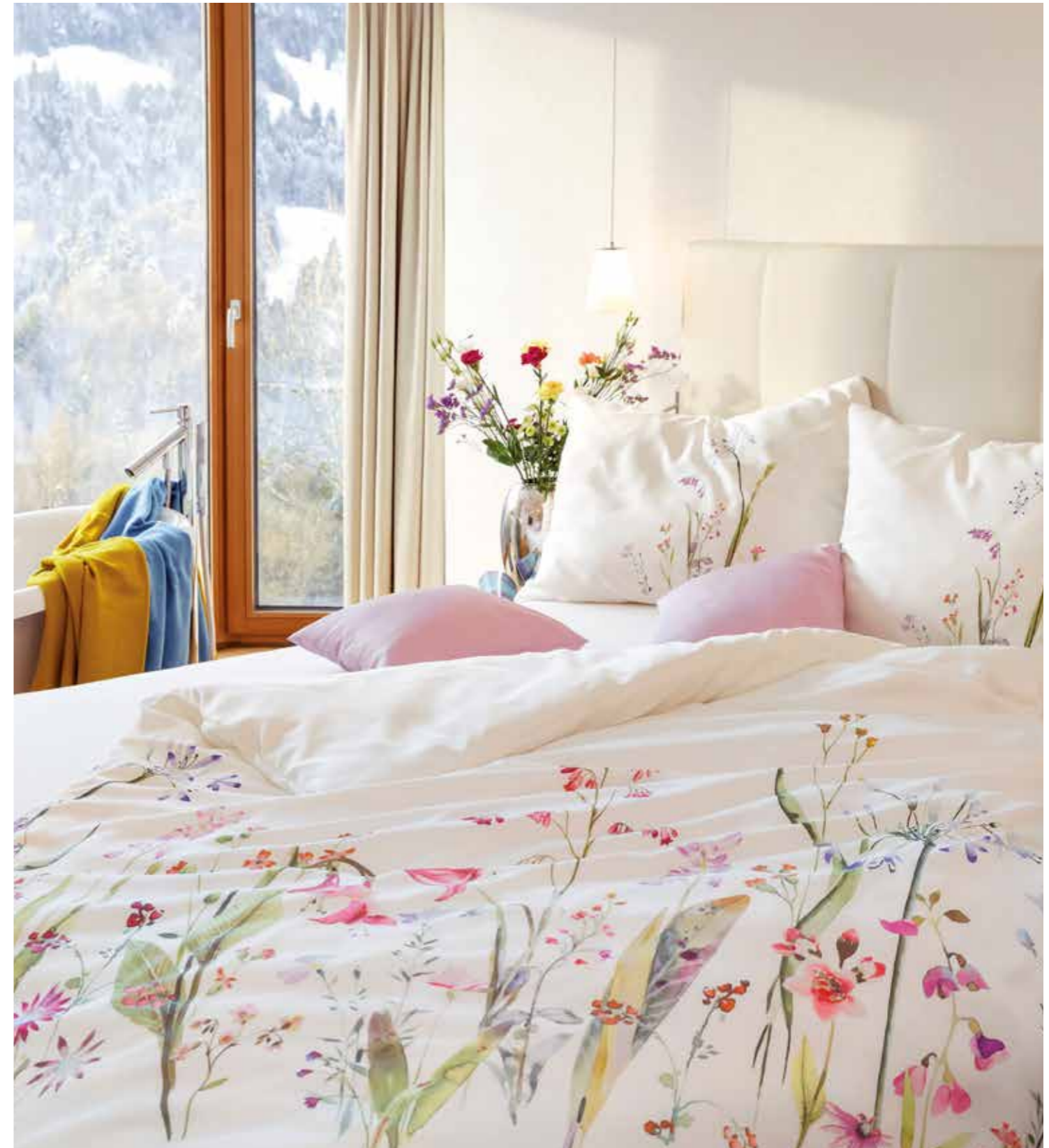
FLEUR * 3962