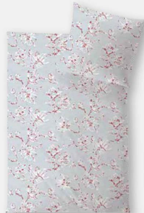
CHIANTI * 4935 | Unterseite weiß / back side white