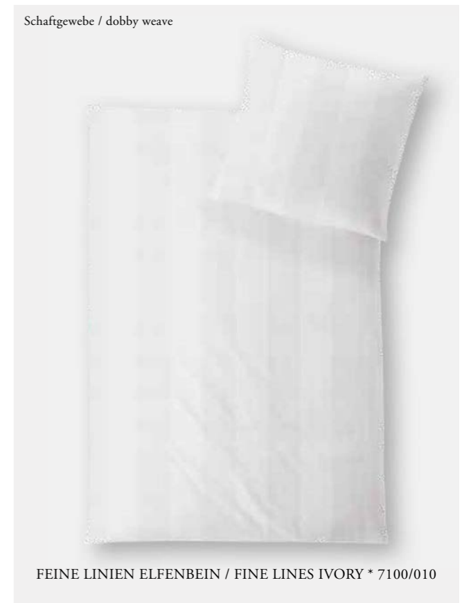
FEINE LINIEN ELFENBEIN / FINE LINES IVORY * 7100/010