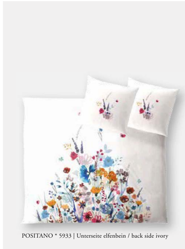
POSITANO * 5933 | Unterseite elfenbein / back side ivory