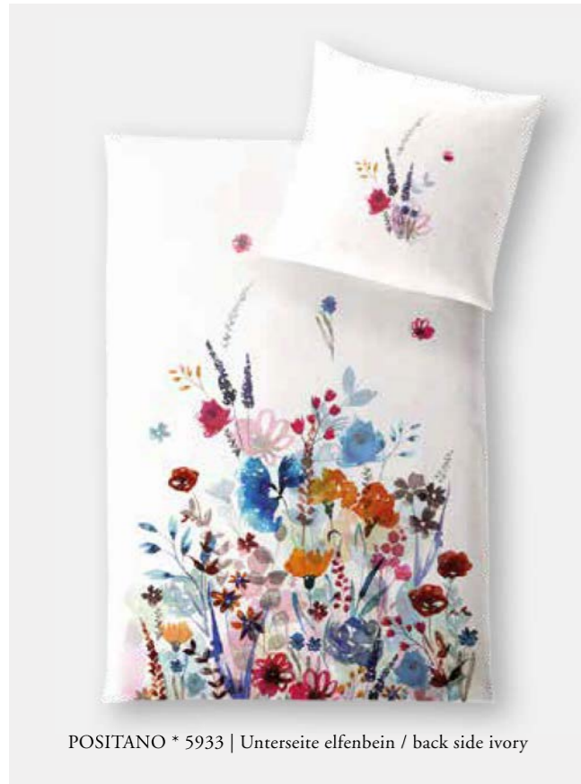
POSITANO * 5933 | Unterseite elfenbein / back side ivory