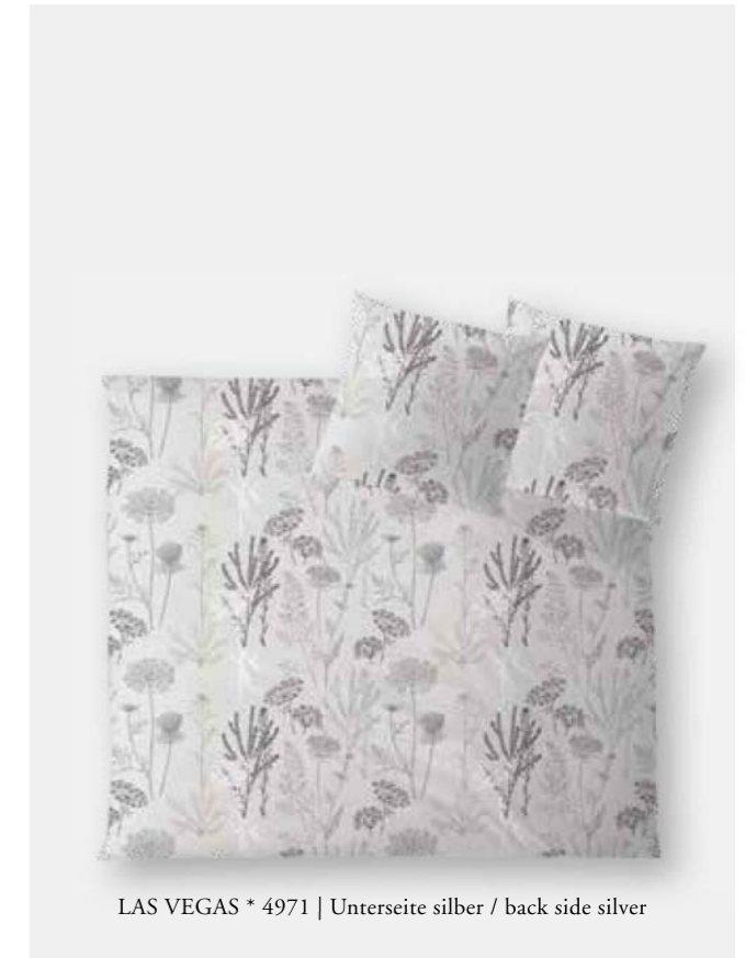
LAS VEGAS * 4971 | Unterseite silber / back side silver