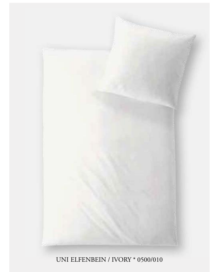
UNI ELFENBEIN / IVORY * 0500/010