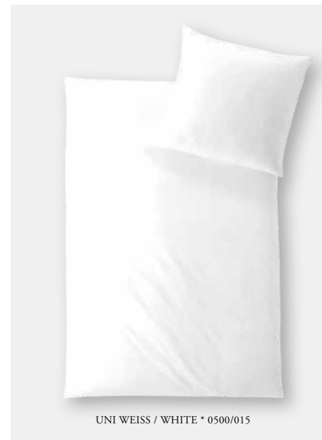
UNI WEISS / WHITE * 0500/015