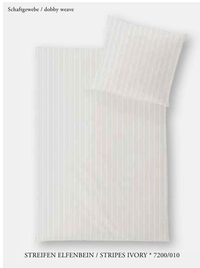
STREIFEN ELFENBEIN / STRIPES IVORY * 7200/010