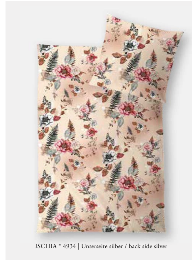
ISCHIA * 4934 | Unterseite silber / back side silver