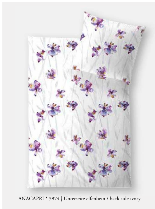
ANACAPRI * 3974 | Unterseite elfenbein / back side ivory