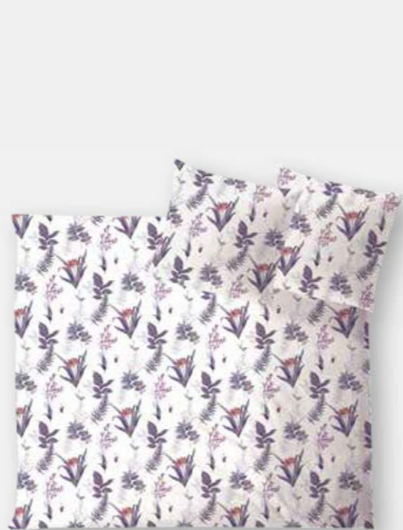
LUCCA * 3975 | Unterseite elfenbein / back side ivory