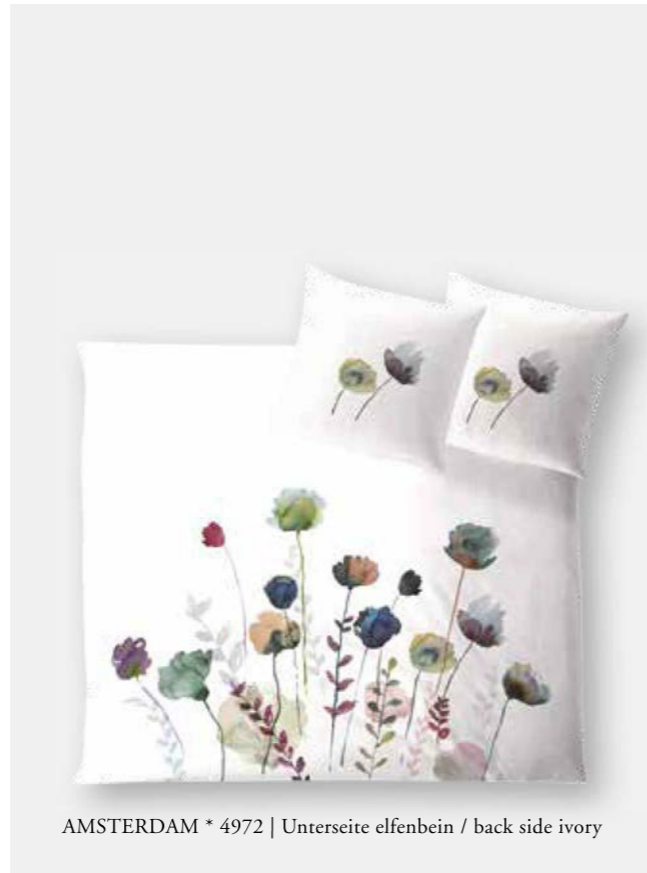
AMSTERDAM * 4972 | Unterseite elfenbein / back side ivory