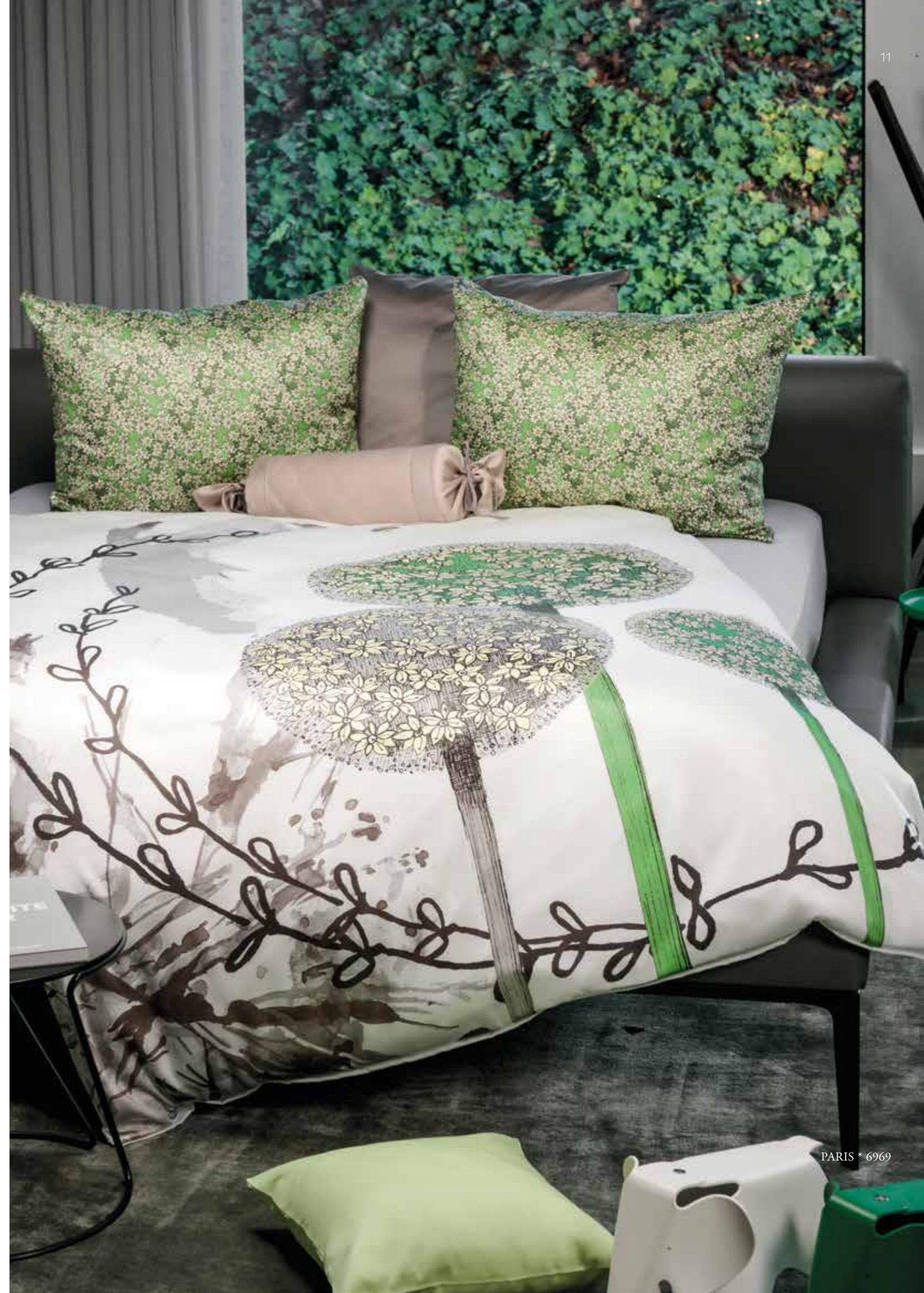
PARIS * 6969