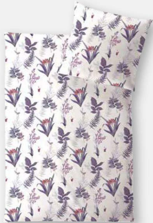
LUCCA * 3975 | Unterseite elfenbein / back side ivory