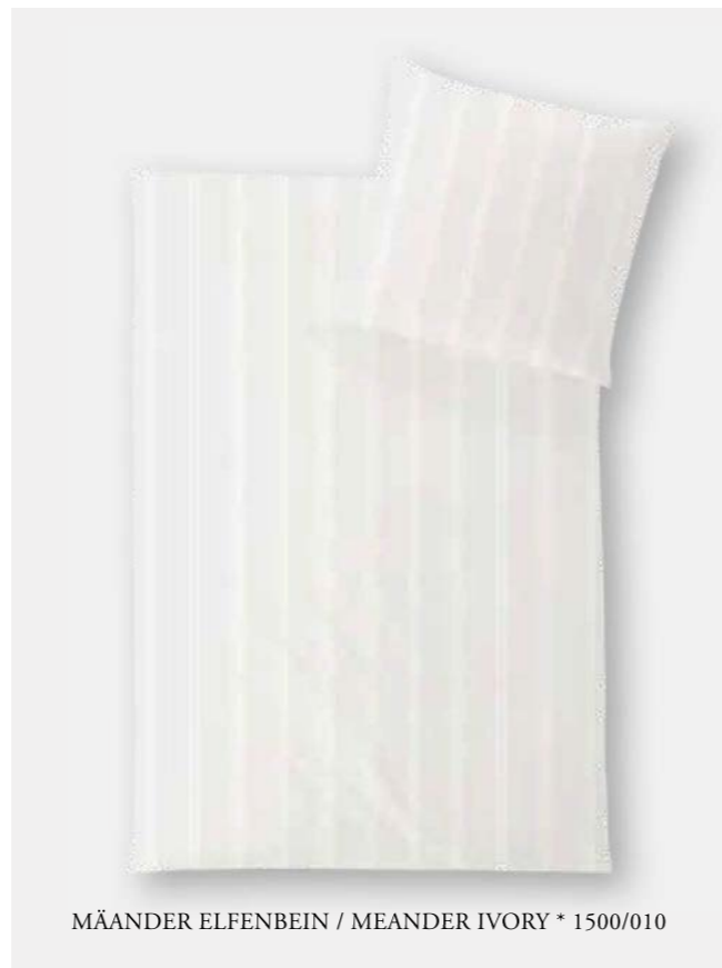
MÄANDER ELFENBEIN / MEANDER IVORY * 1500/010