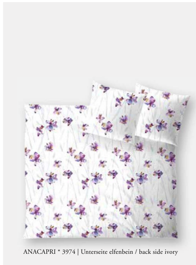
ANACAPRI * 3974 | Unterseite elfenbein / back side ivory