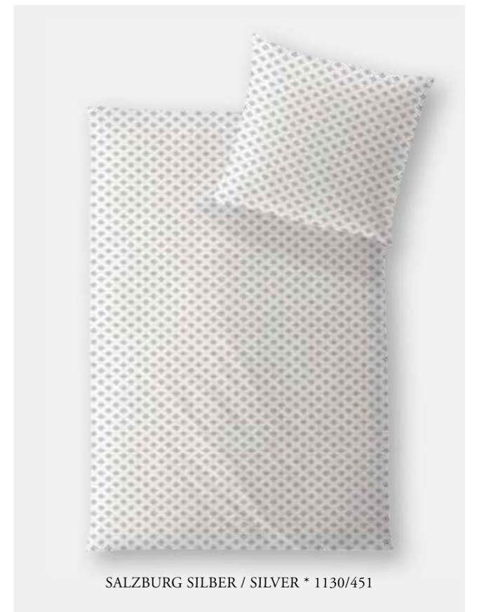
SALZBURG SILBER / SILVER * 1130/451