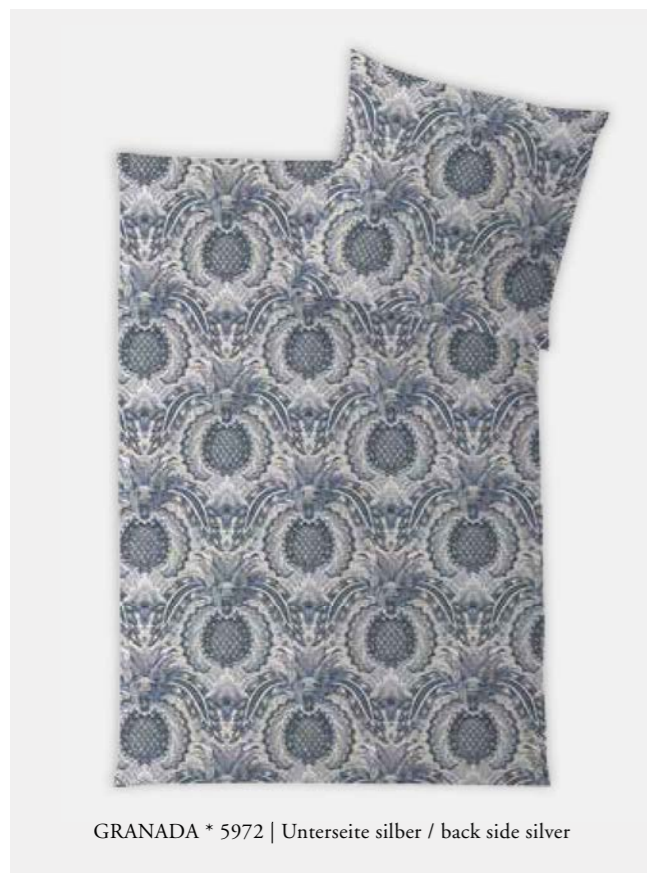
GRANADA * 5972 | Unterseite silber / back side silver