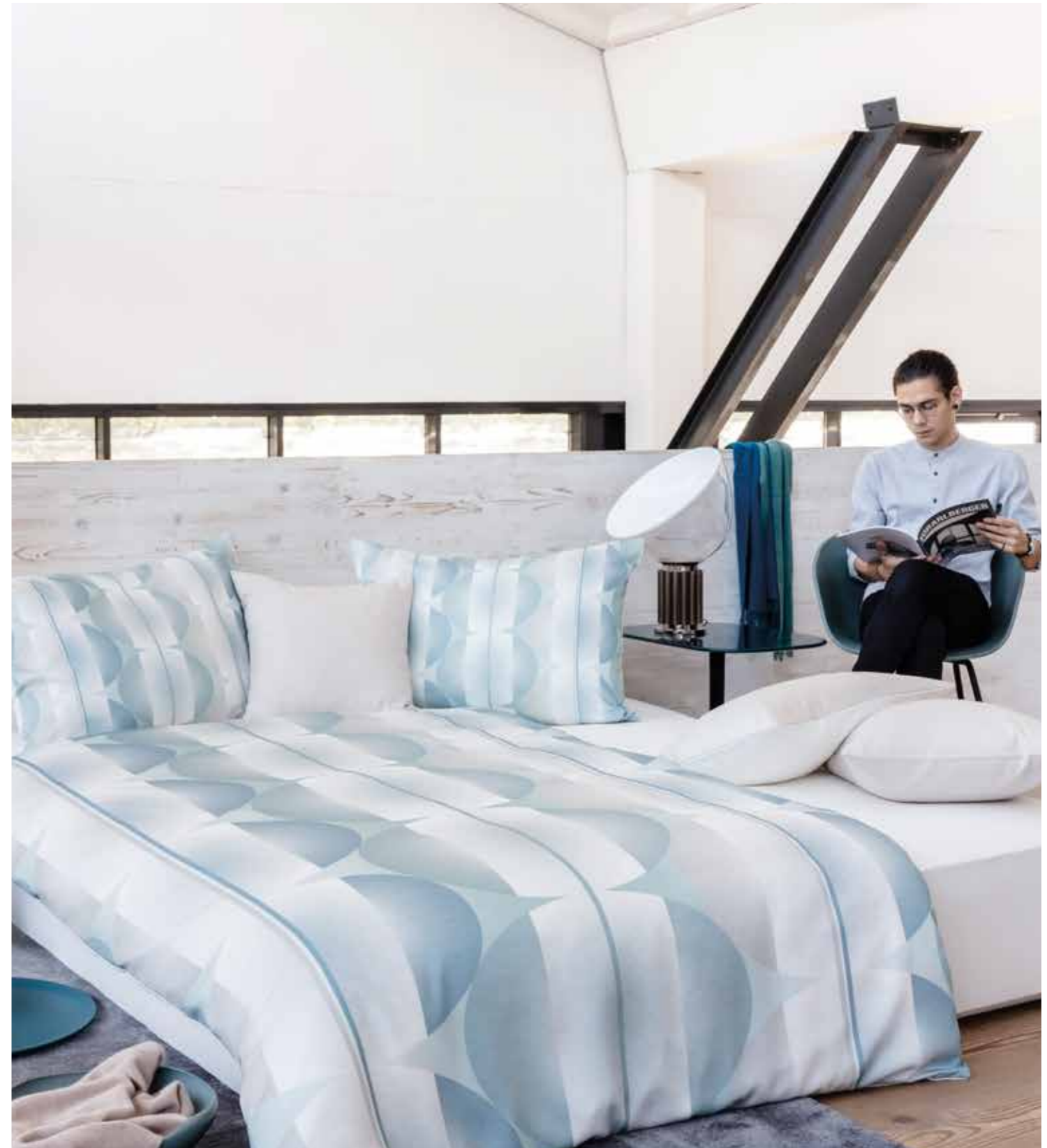
HAMPTONS * 6931