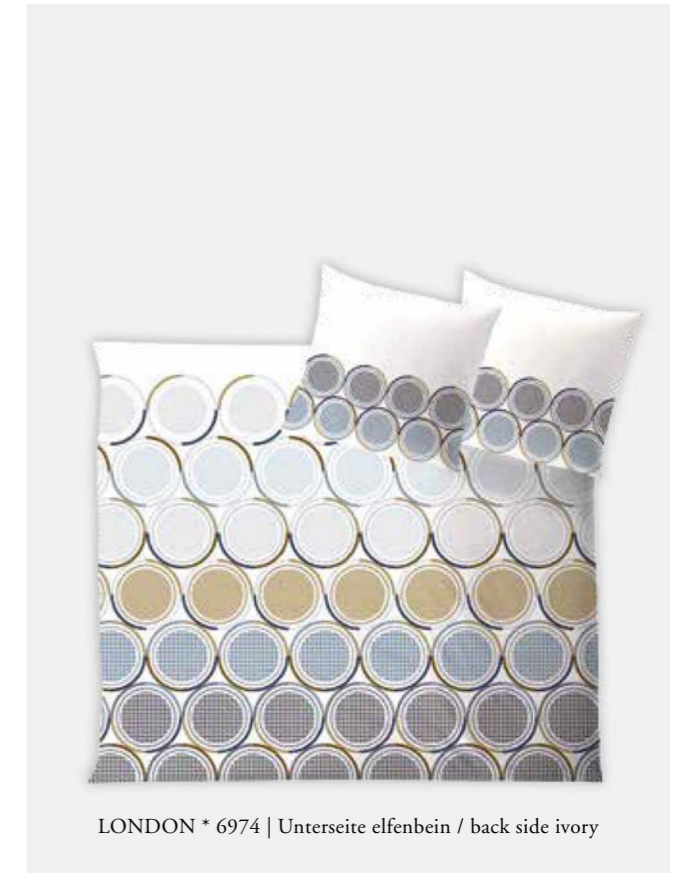
LONDON * 6974 | Unterseite elfenbein / back side ivory