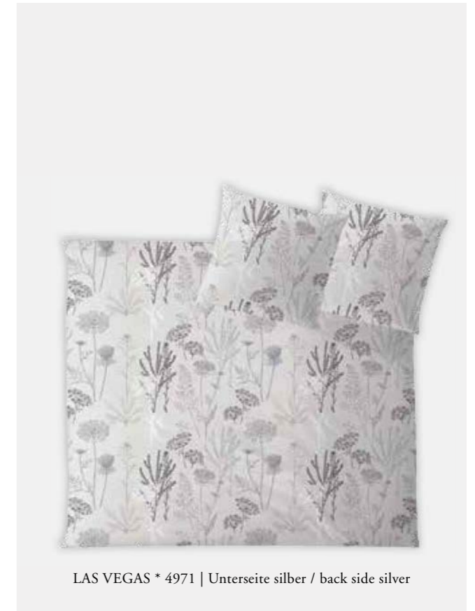
LAS VEGAS * 4971 | Unterseite silber / back side silver