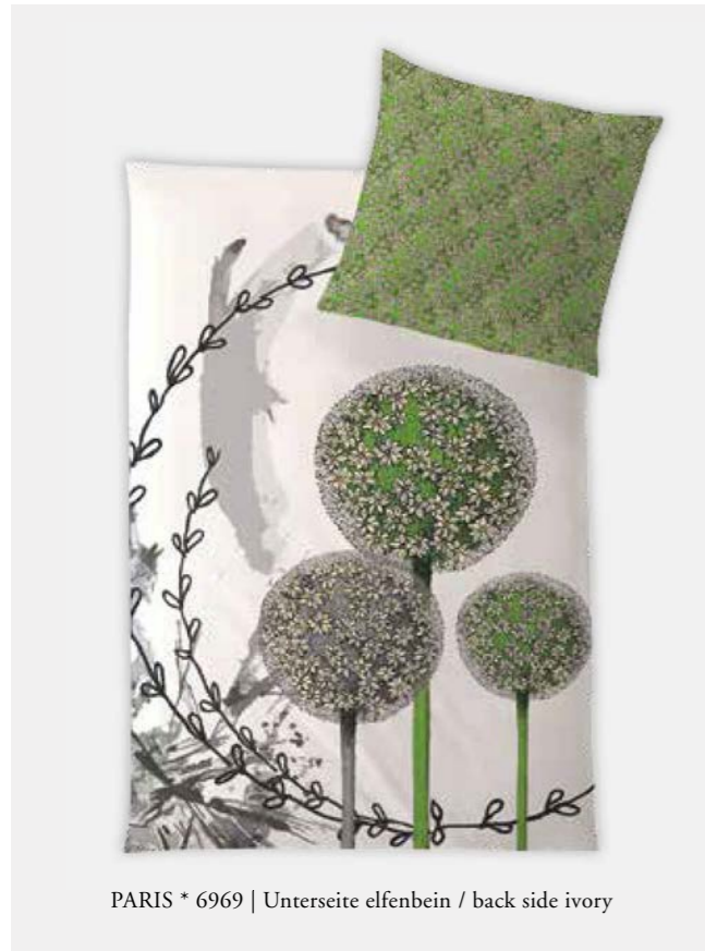
PARIS * 6969 | Unterseite elfenbein / back side ivory