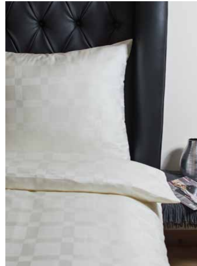
Schafgewebe / dooby weave