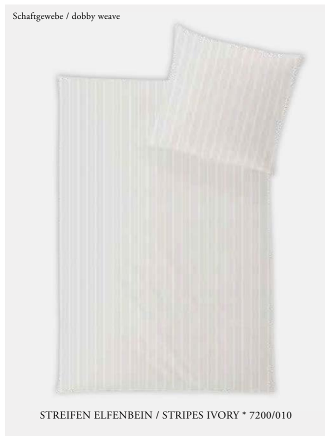
STREIFEN ELFENBEIN / STRIPES IVORY * 7200/010