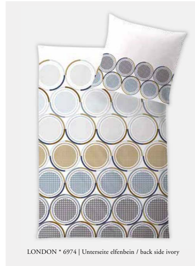
LONDON * 6974 | Unterseite elfenbein / back side ivory