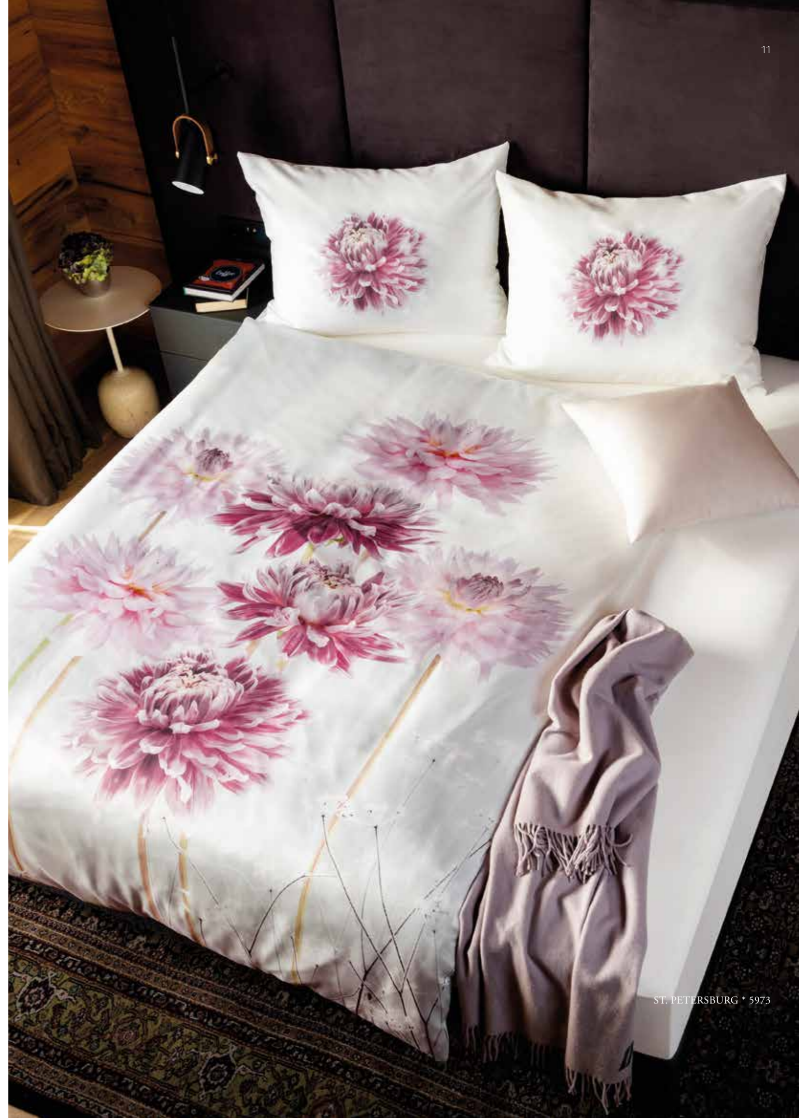
ST. PETERSBURG * 5973