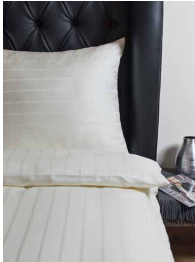
Schafgewebe / dooby weave