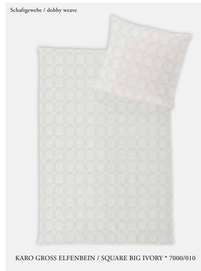
KARO GROSS ELFENBEIN / SQUARE BIG IVORY * 7000/010