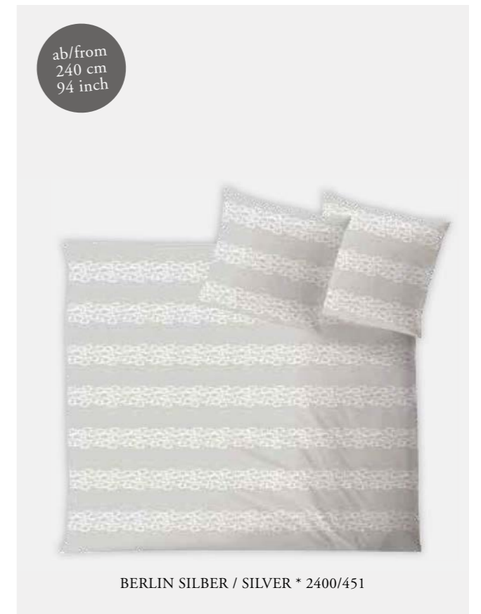
BERLIN SILBER / SILVER * 2400/451

HINWEIS: Bei der Classic Collection werden die Designs ab einer Breite über 240 cm gedreht konfektioniert (siehe Beispiel) NOTE: The Classic designs are turned in an 90° angle for duvet covers with a width of more than 240 cm / 94 inch (see example)