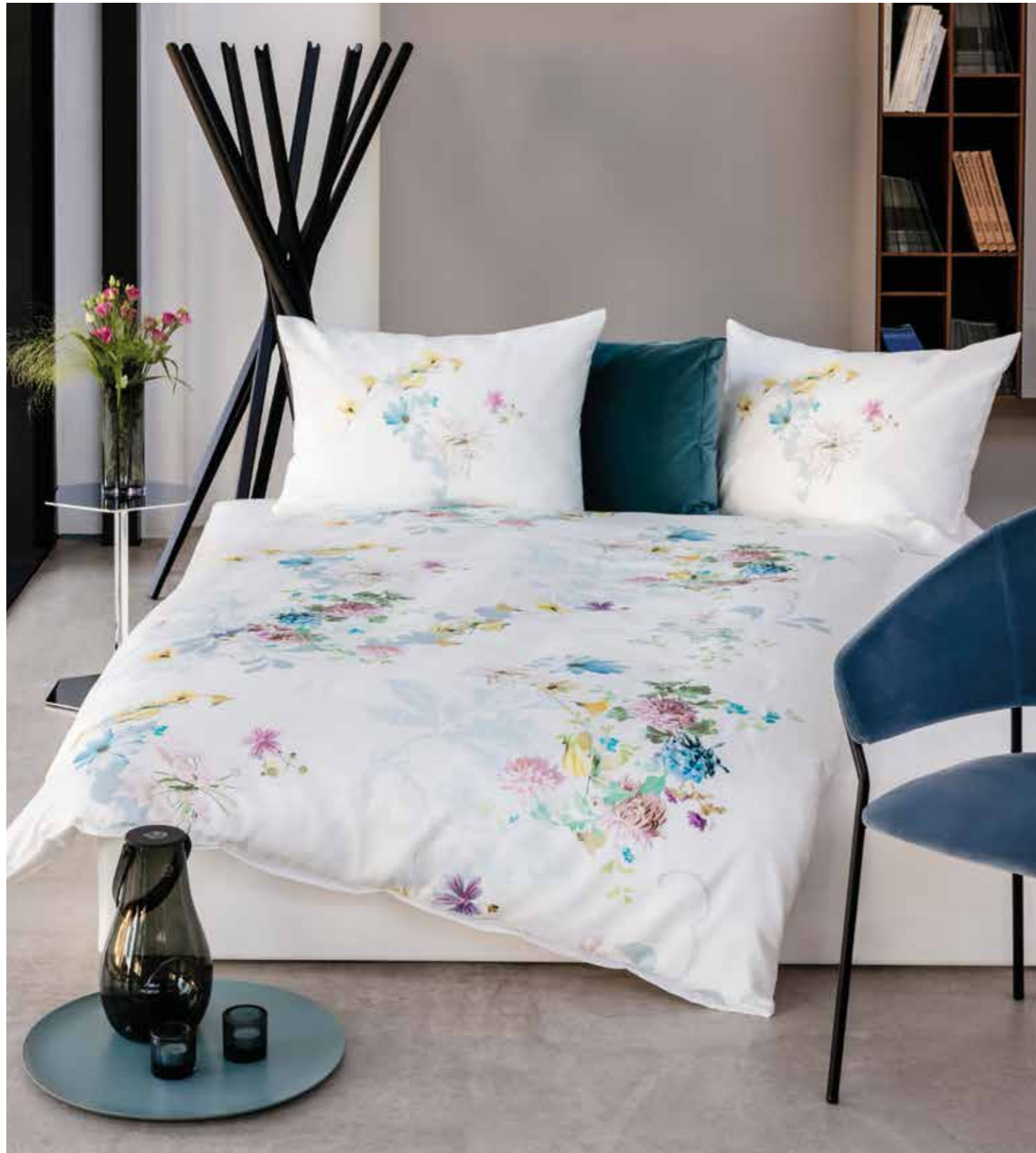
MALLORCA * 4931