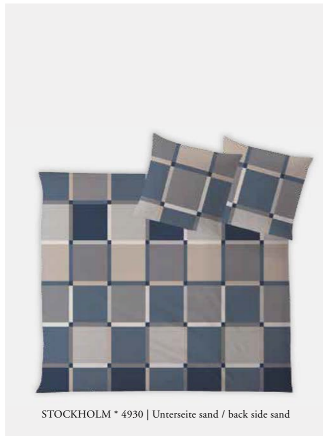
STOCKHOLM * 4930 | Unterseite sand / back side sand