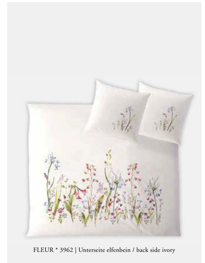
FLEUR * 3962 | Unterseite elfenbein / back side ivory

HINWEIS: Farbabweichungen zwischen Einzel- und Doppelbettbezügen sind möglich NOTE: Colour deviations between single and dual duvet covers are possible