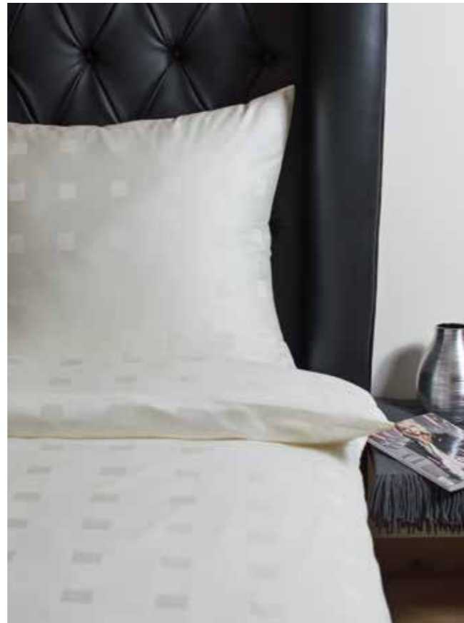
Schafgewebe / dooby weave