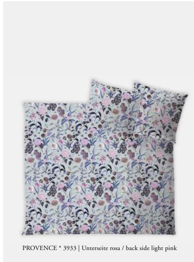
PROVENCE * 3933 | Unterseite rosa / back side light pink