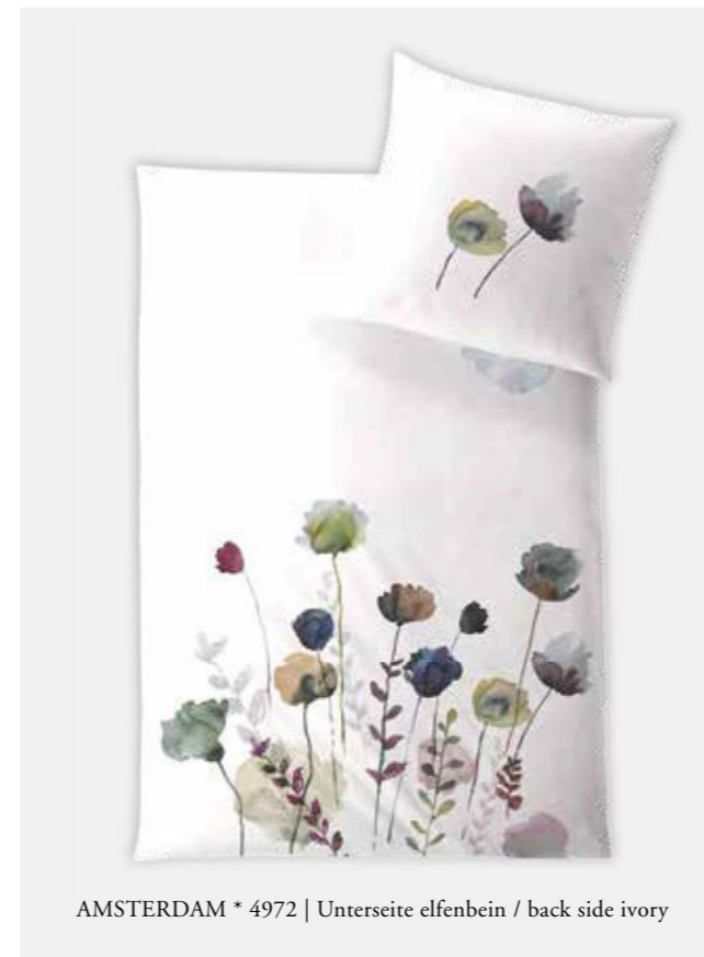
AMSTERDAM * 4972 | Unterseite elfenbein / back side ivory