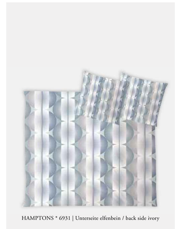
HAMPTONS * 6931 | Unterseite elfenbein / back side ivory

HINWEIS: Farbabweichungen zwischen Einzel- und Doppelbettbezügen sind möglich NOTE: Colour deviations between single and dual duvet covers are possible