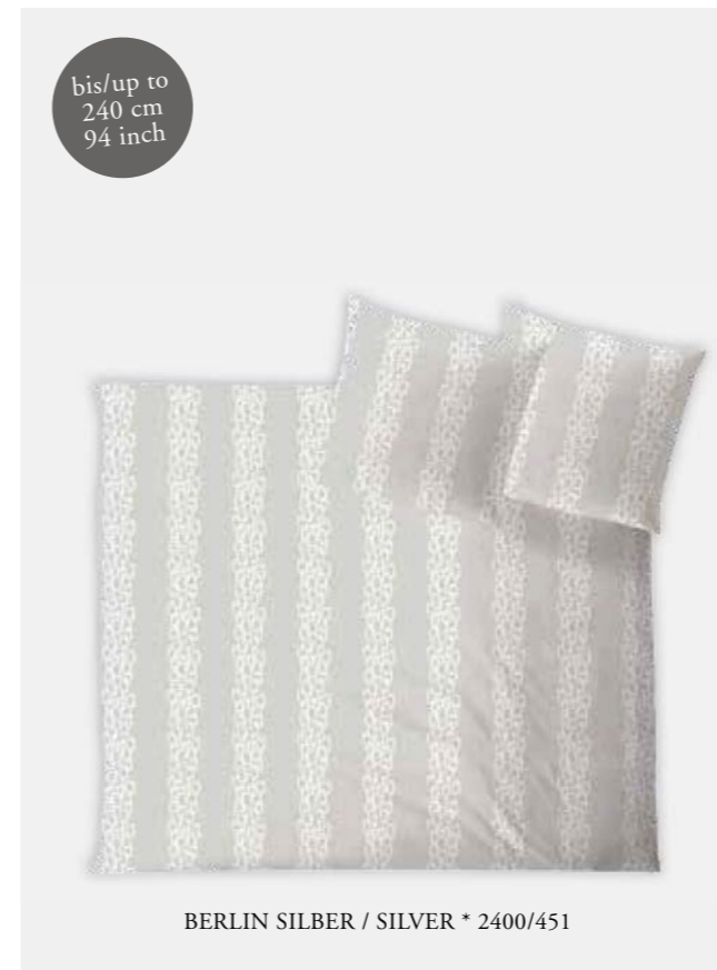
BERLIN SILBER / SILVER * 2400/451