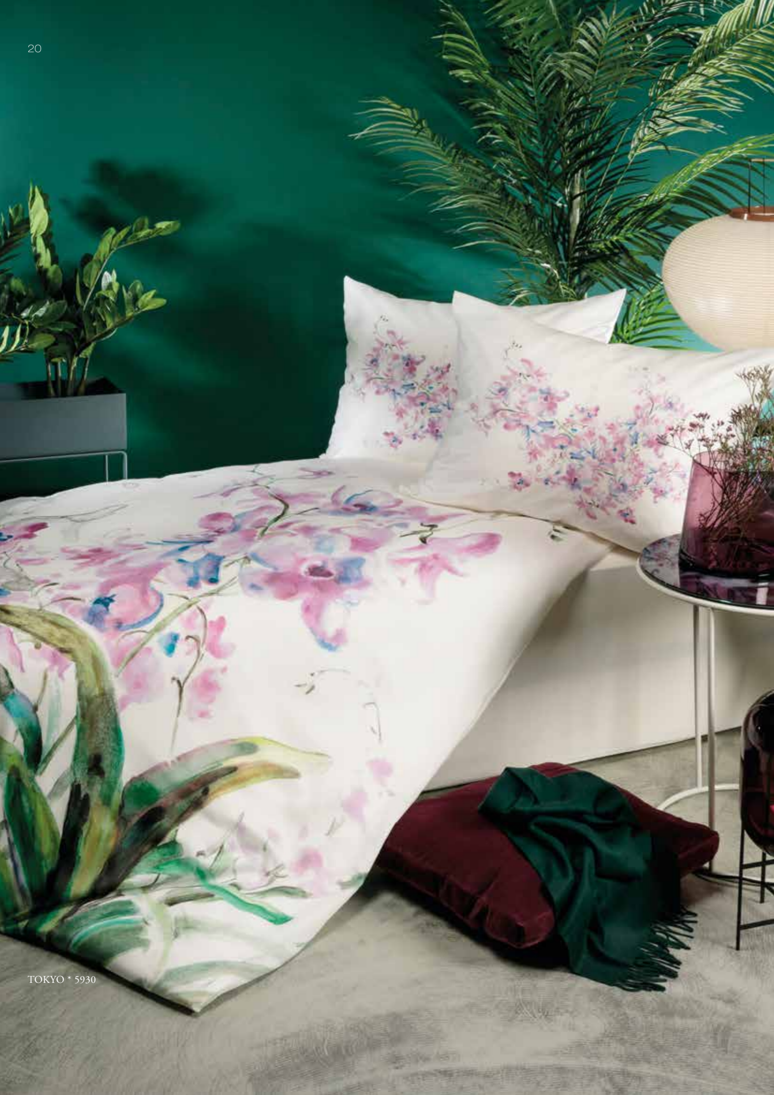
TOKYO * 5930