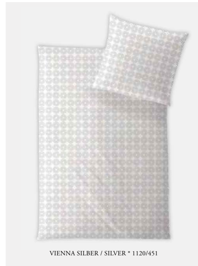
VIENNA SILBER / SILVER * 1120/451