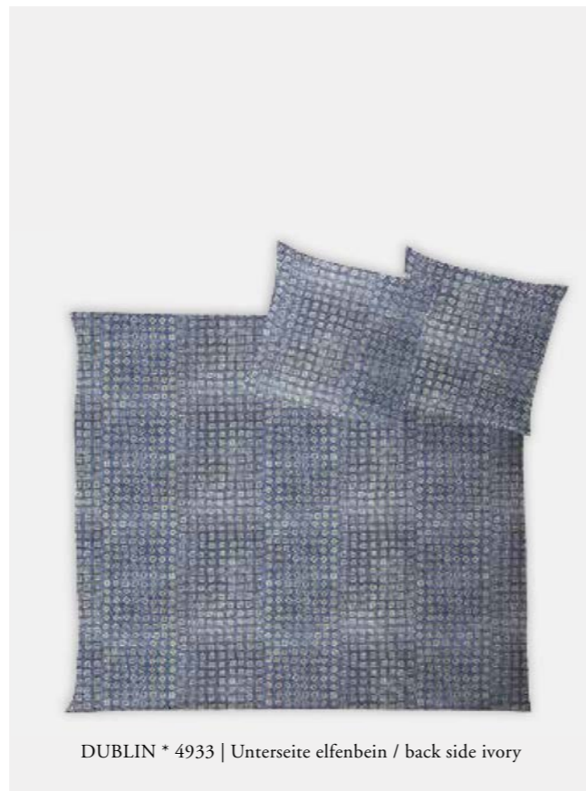
DUBLIN * 4933 | Unterseite elfenbein / back side ivory