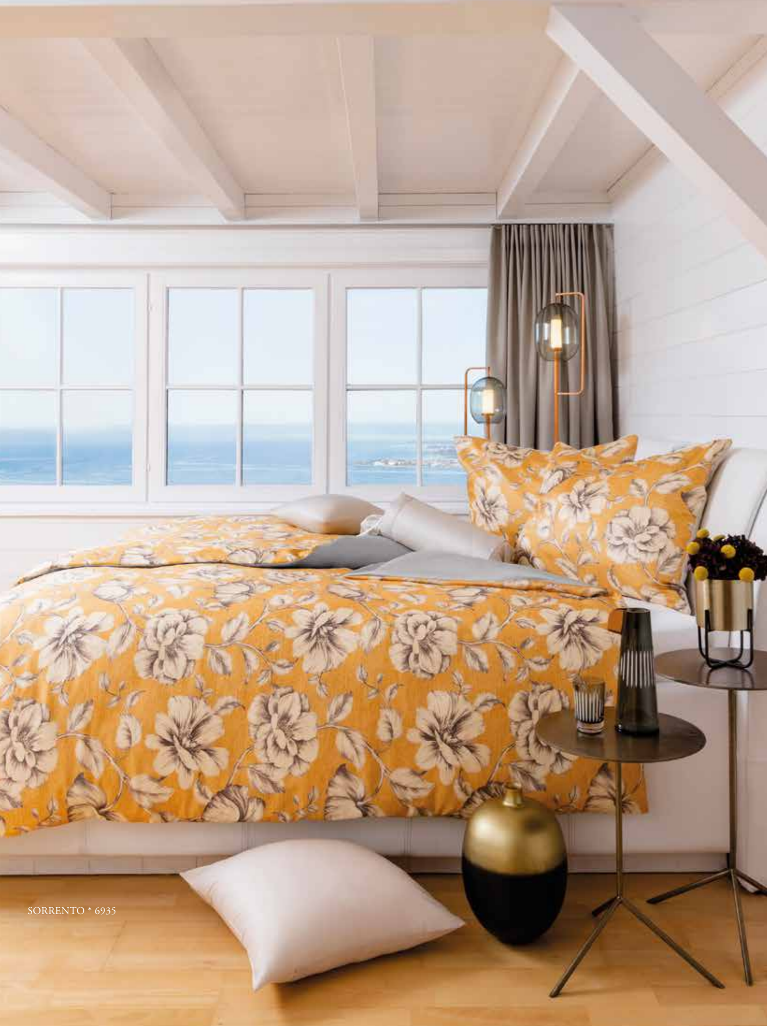
SORRENTO * 6935