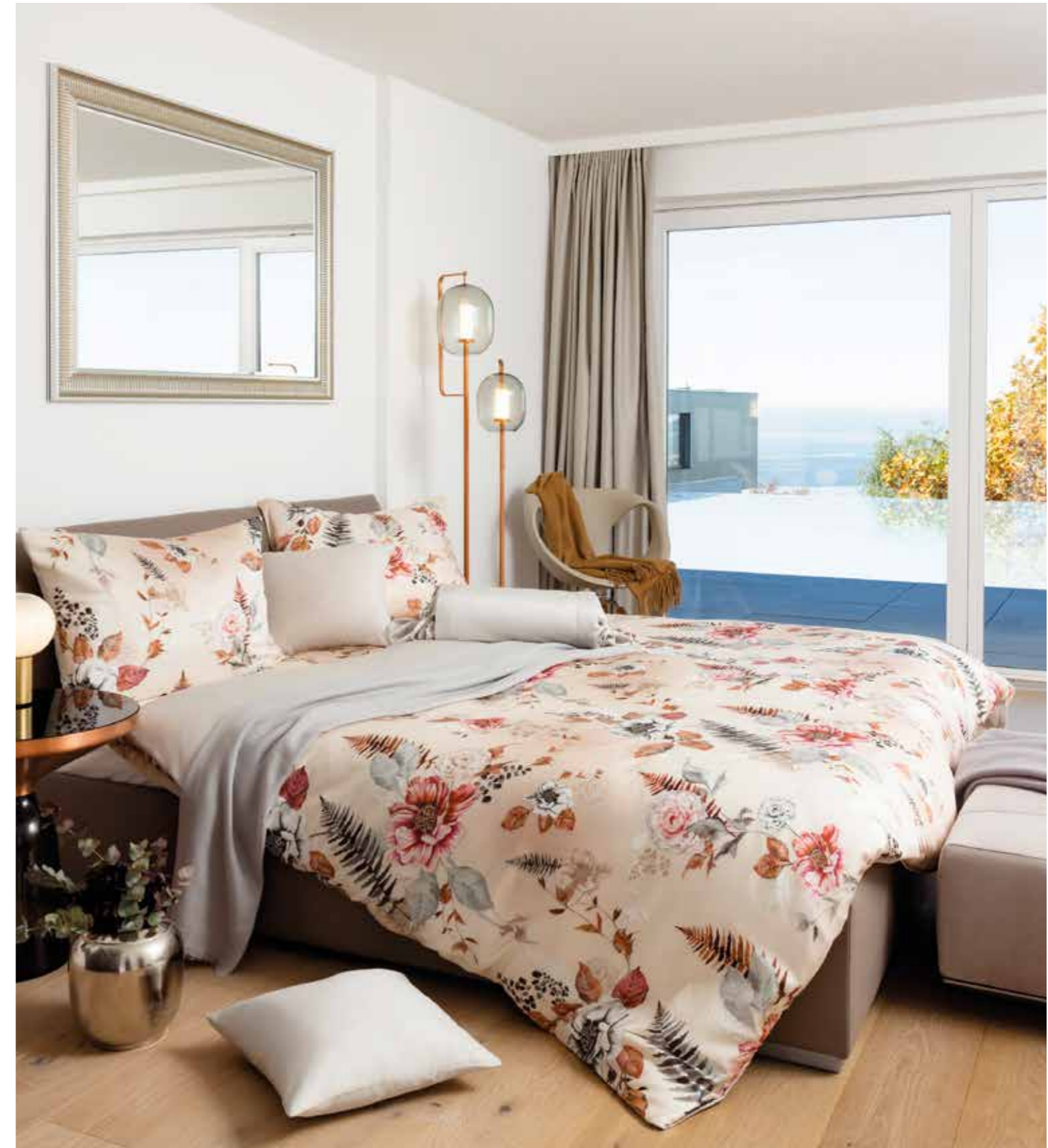
ISCHIA * 4934