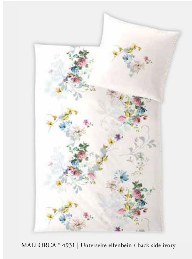
MALLORCA * 4931 | Unterseite elfenbein / back side ivory