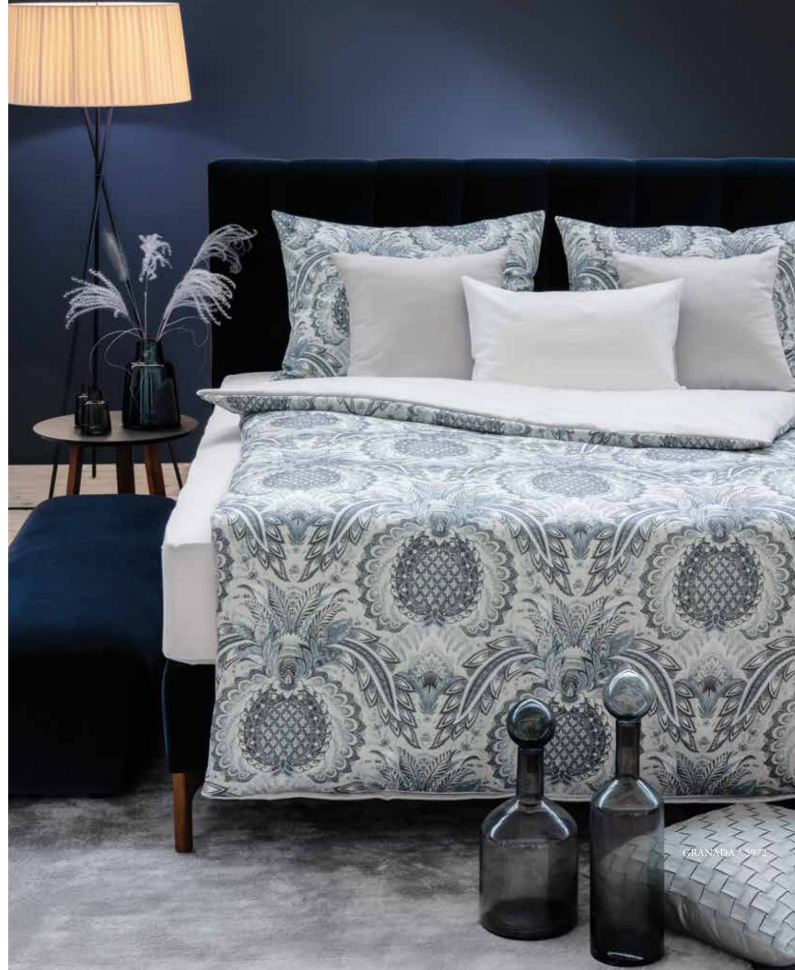
GRANADA * 5972