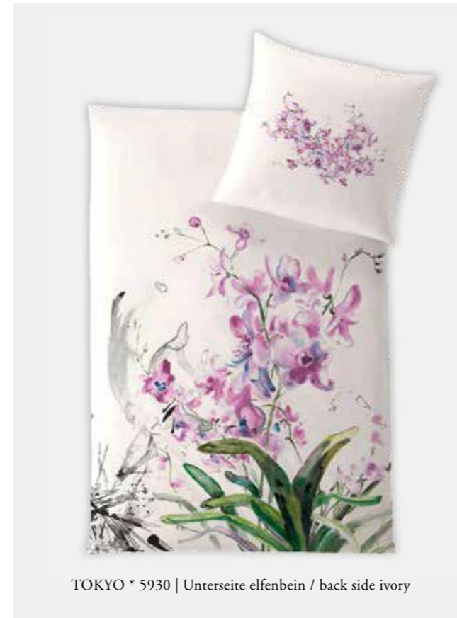
TOKYO * 5930 | Unterseite elfenbein / back side ivory