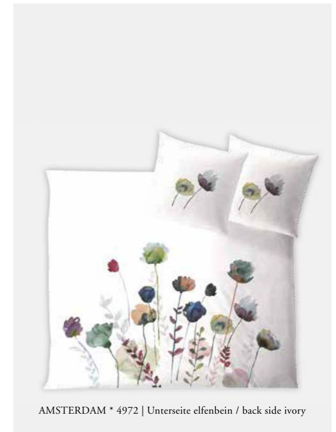
AMSTERDAM * 4972 | Unterseite elfenbein / back side ivory

HINWEIS: Farbabweichungen zwischen Einzel- und Doppelbettbezügen sind möglich NOTE: Colour deviations between single and dual duvet covers are possible