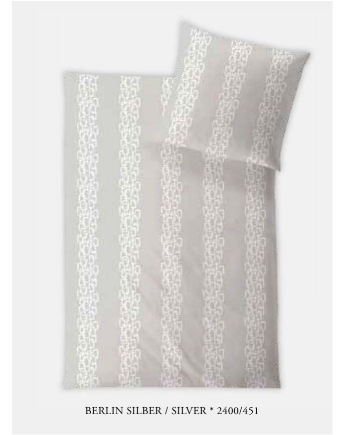
BERLIN SILBER / SILVER * 2400/451