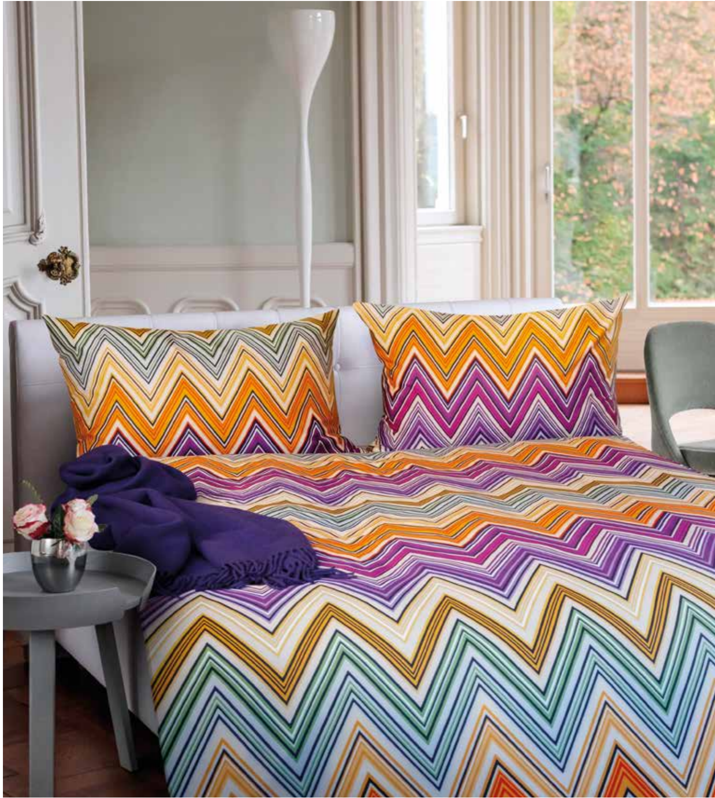
VENEZIA * 6934