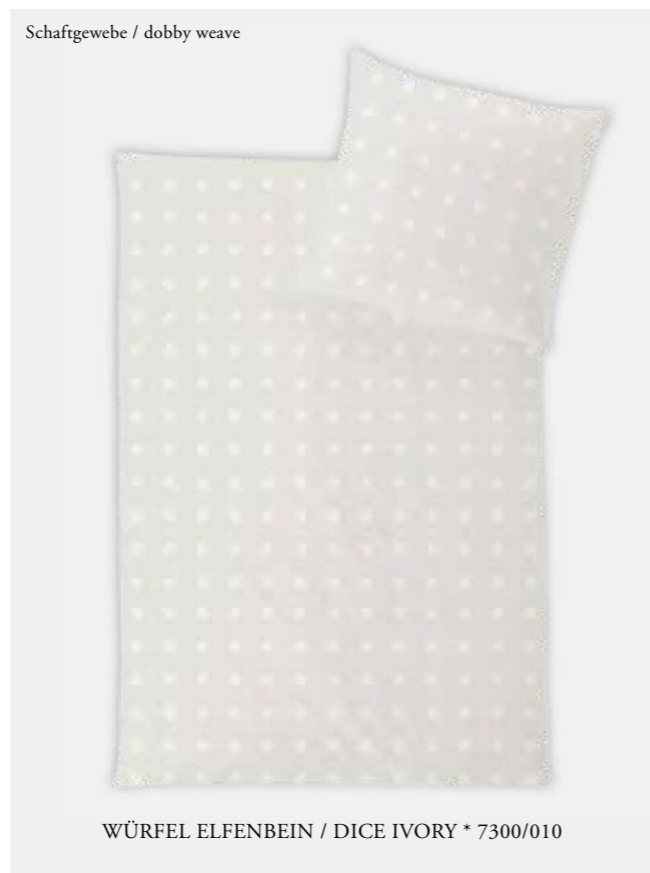
WÜRFEL ELFENBEIN / DICE IVORY * 7300/010