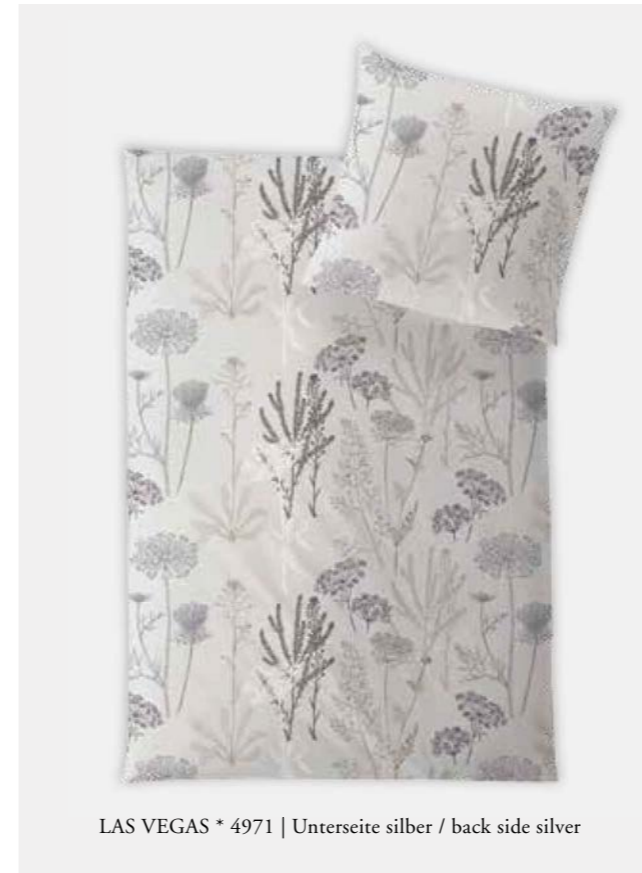
LAS VEGAS * 4971 | Unterseite silber / back side silver