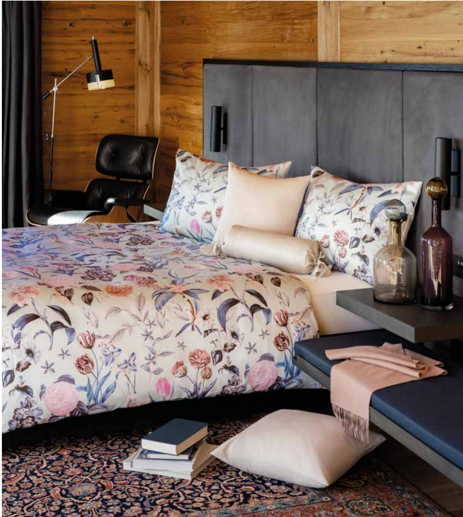
PROVENCE * 3933