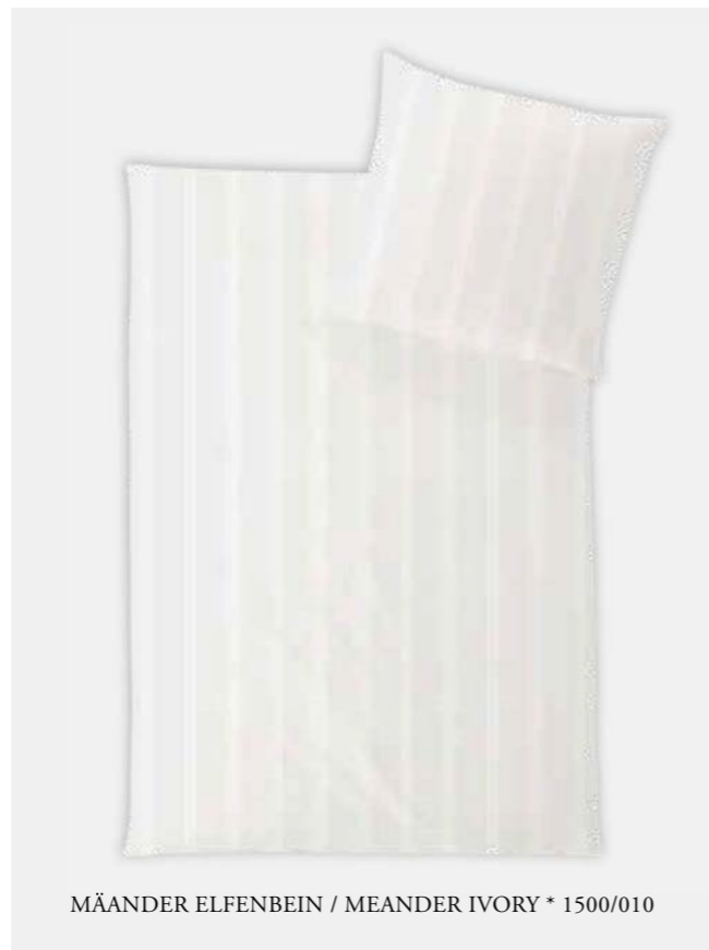
MÄANDER ELFENBEIN / MEANDER IVORY * 1500/010