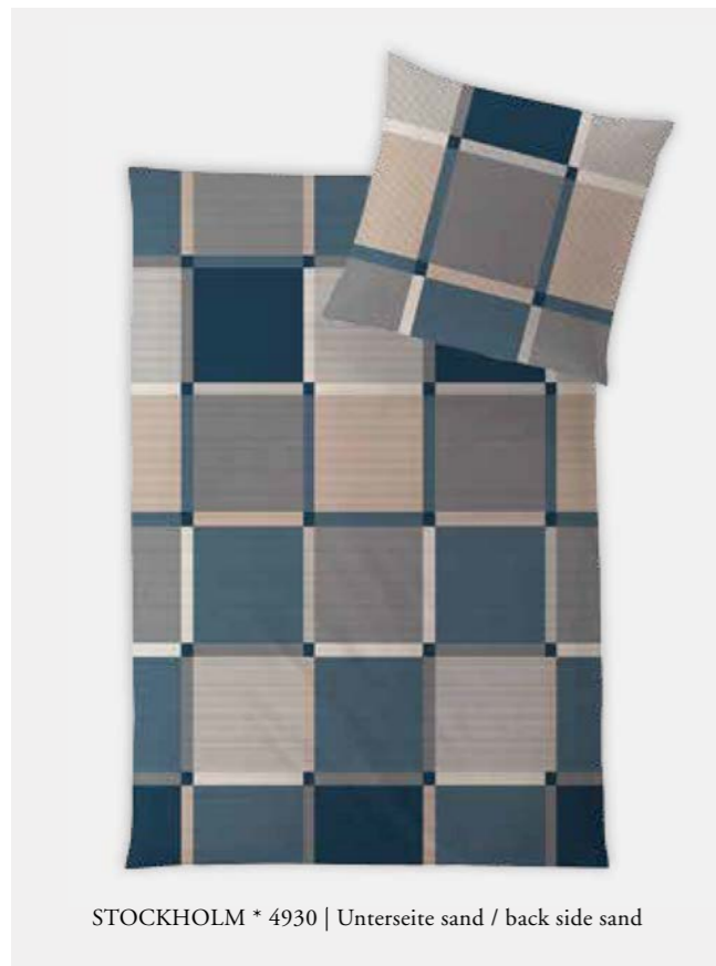
STOCKHOLM * 4930 | Unterseite sand / back side sand