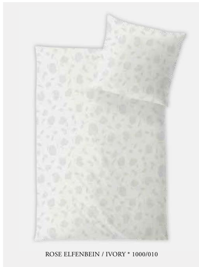
ROSE ELFENBEIN / IVORY * 1000/010