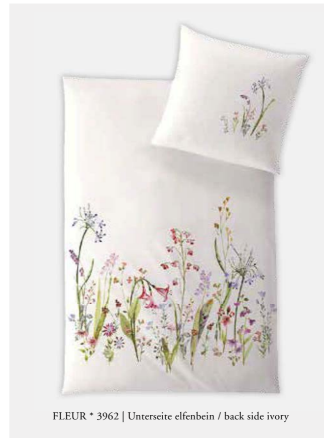
FLEUR * 3962 | Unterseite elfenbein / back side ivory