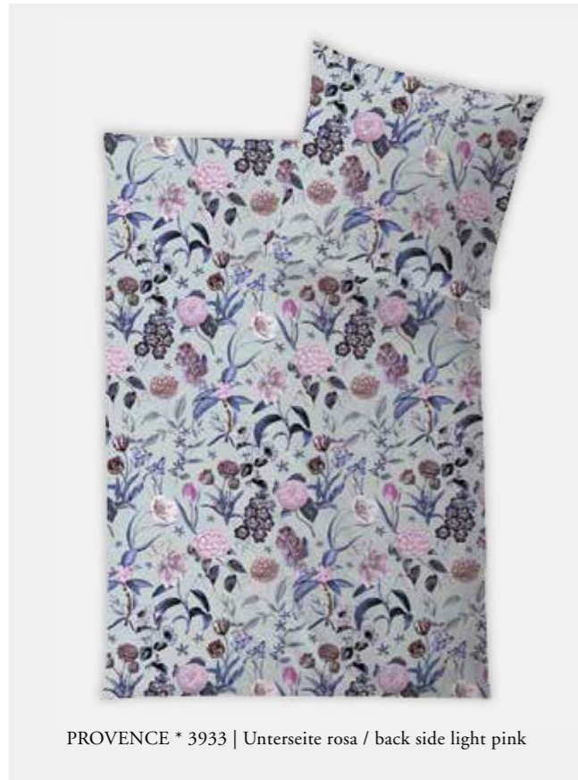
PROVENCE * 3933 | Unterseite rosa / back side light pink