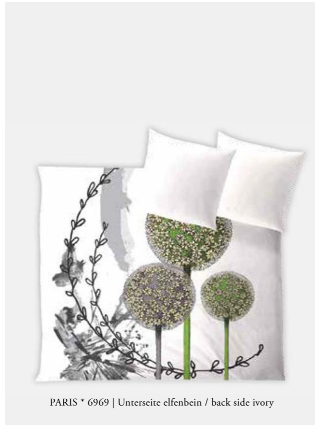
PARIS * 6969 | Unterseite elfenbein / back side ivory