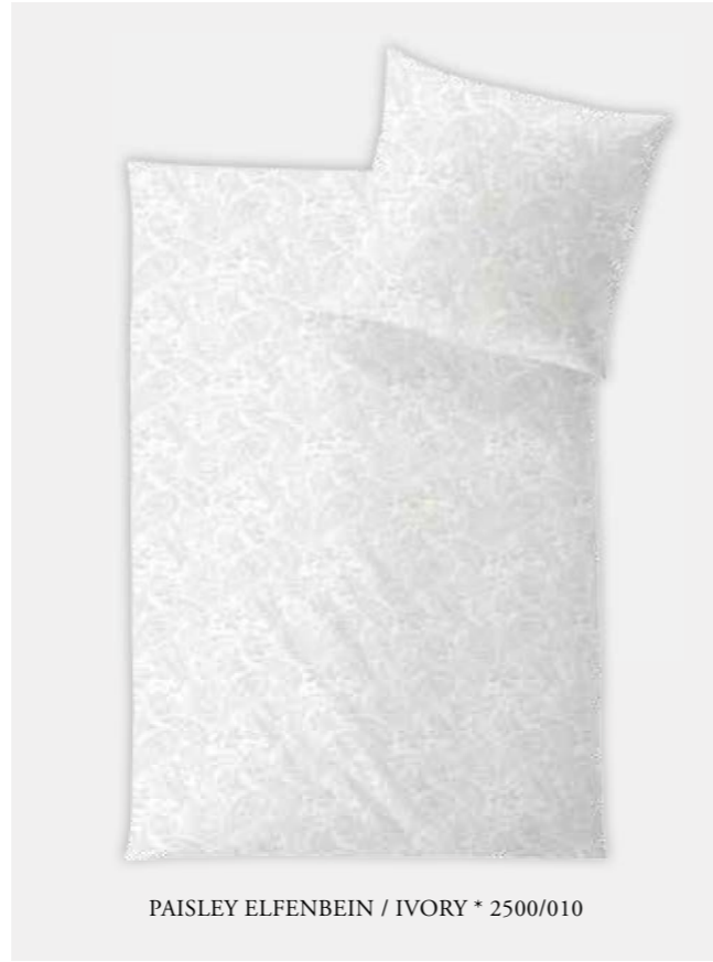
PAISLEY ELFENBEIN / IVORY * 2500/010