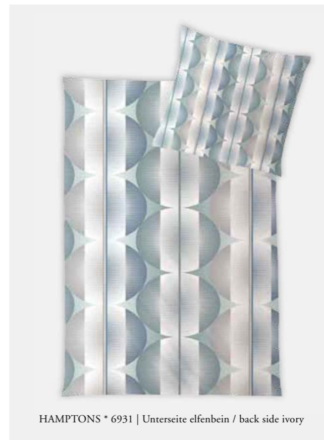
HAMPTONS * 6931 | Unterseite elfenbein / back side ivory