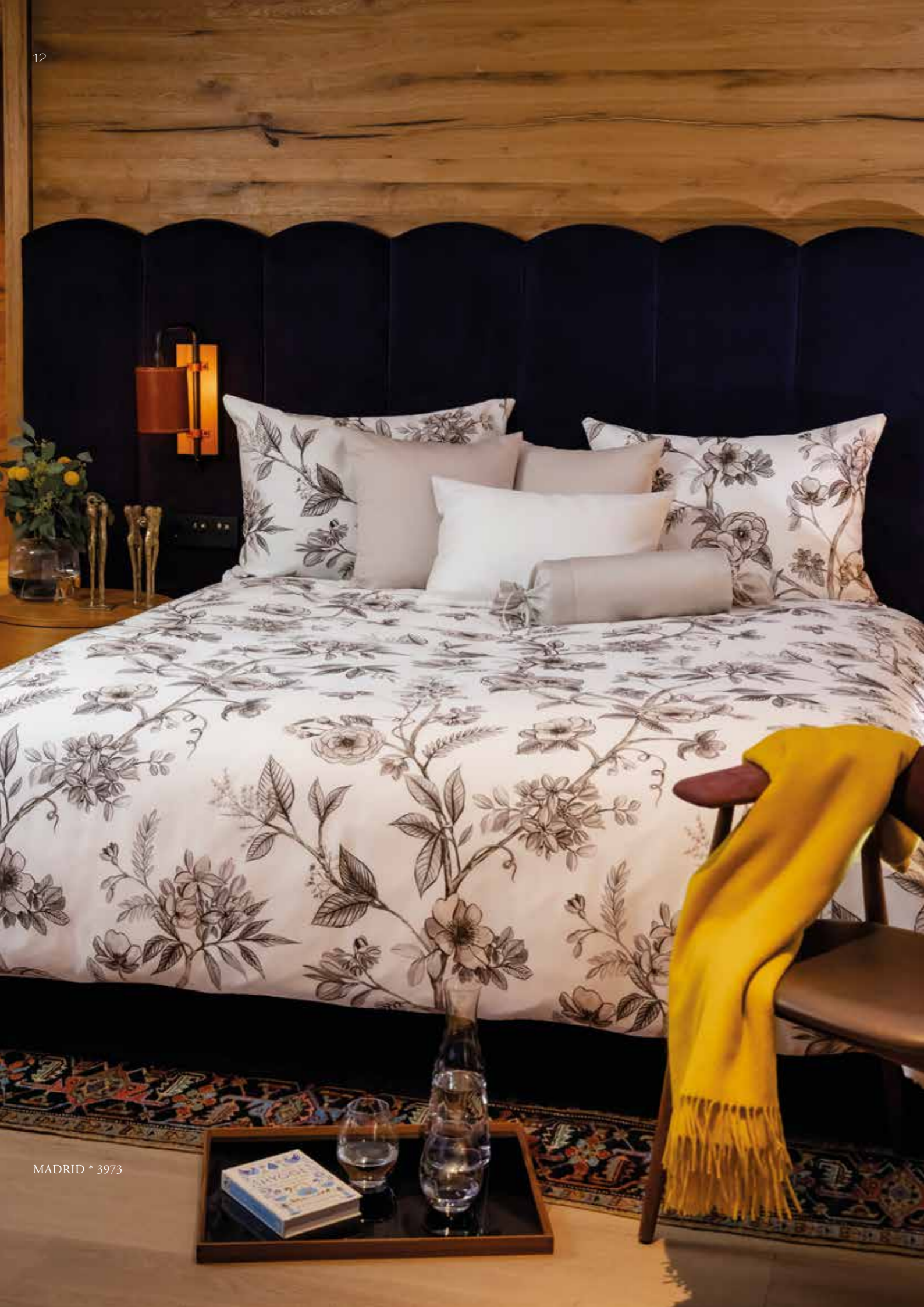
MADRID * 3973