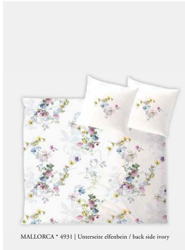
MALLORCA * 4931 | Unterseite elfenbein / back side ivory