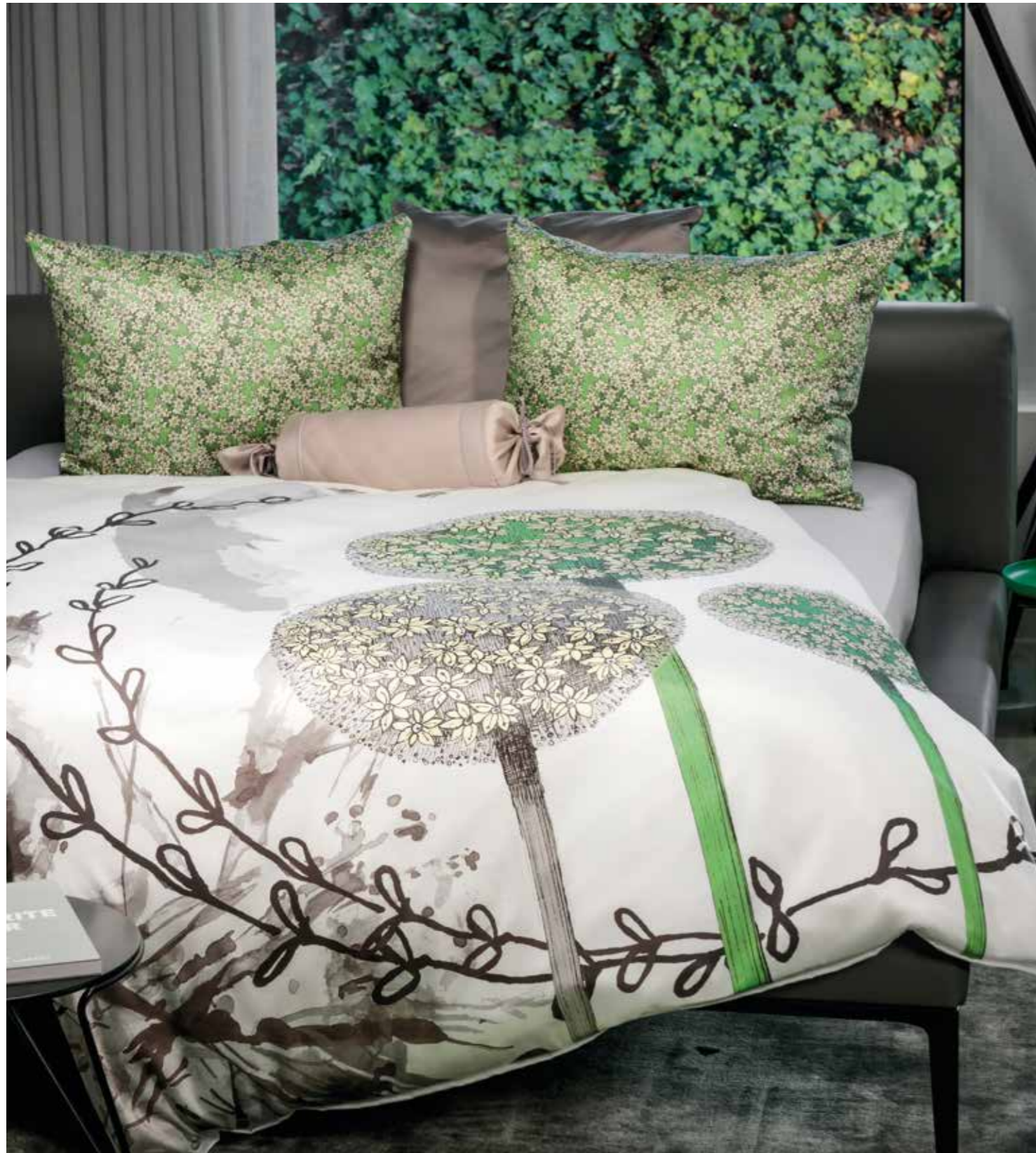
PARIS * 6969