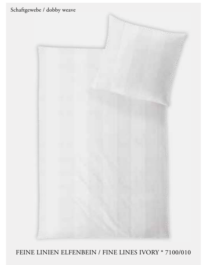
FEINE LINIEN ELFENBEIN / FINE LINES IVORY * 7100/010