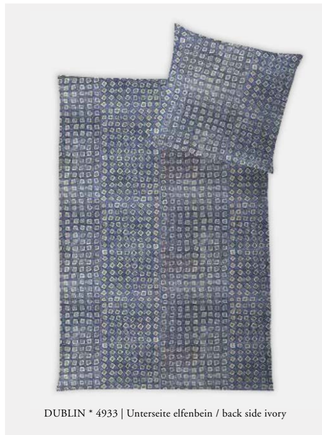
DUBLIN * 4933 | Unterseite elfenbein / back side ivory