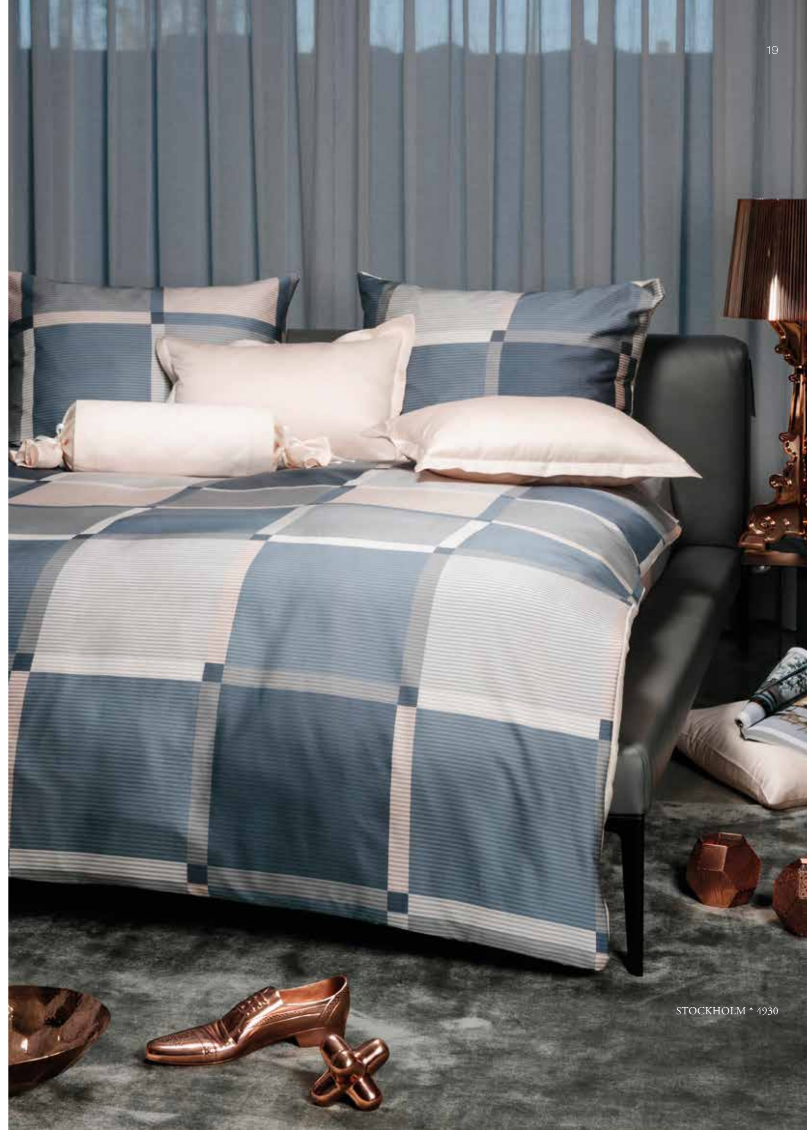
STOCKHOLM * 4930