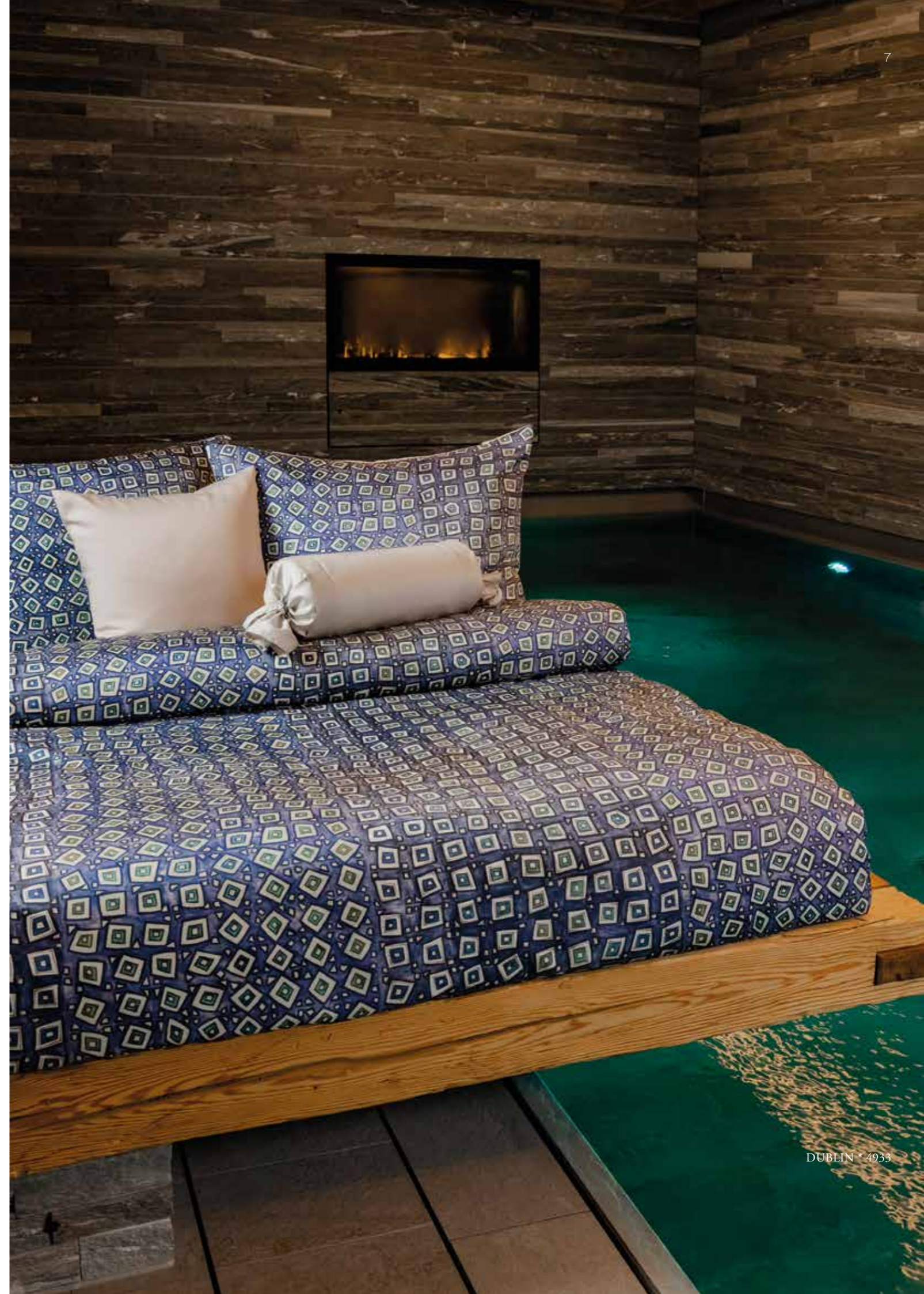
DUBLIN * 4933