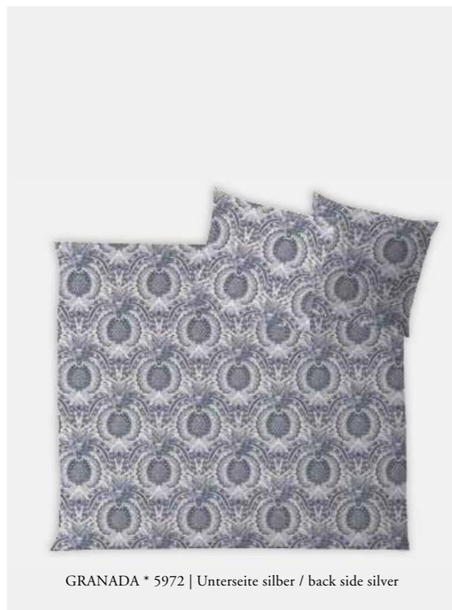
GRANADA * 5972 | Unterseite silber / back side silver