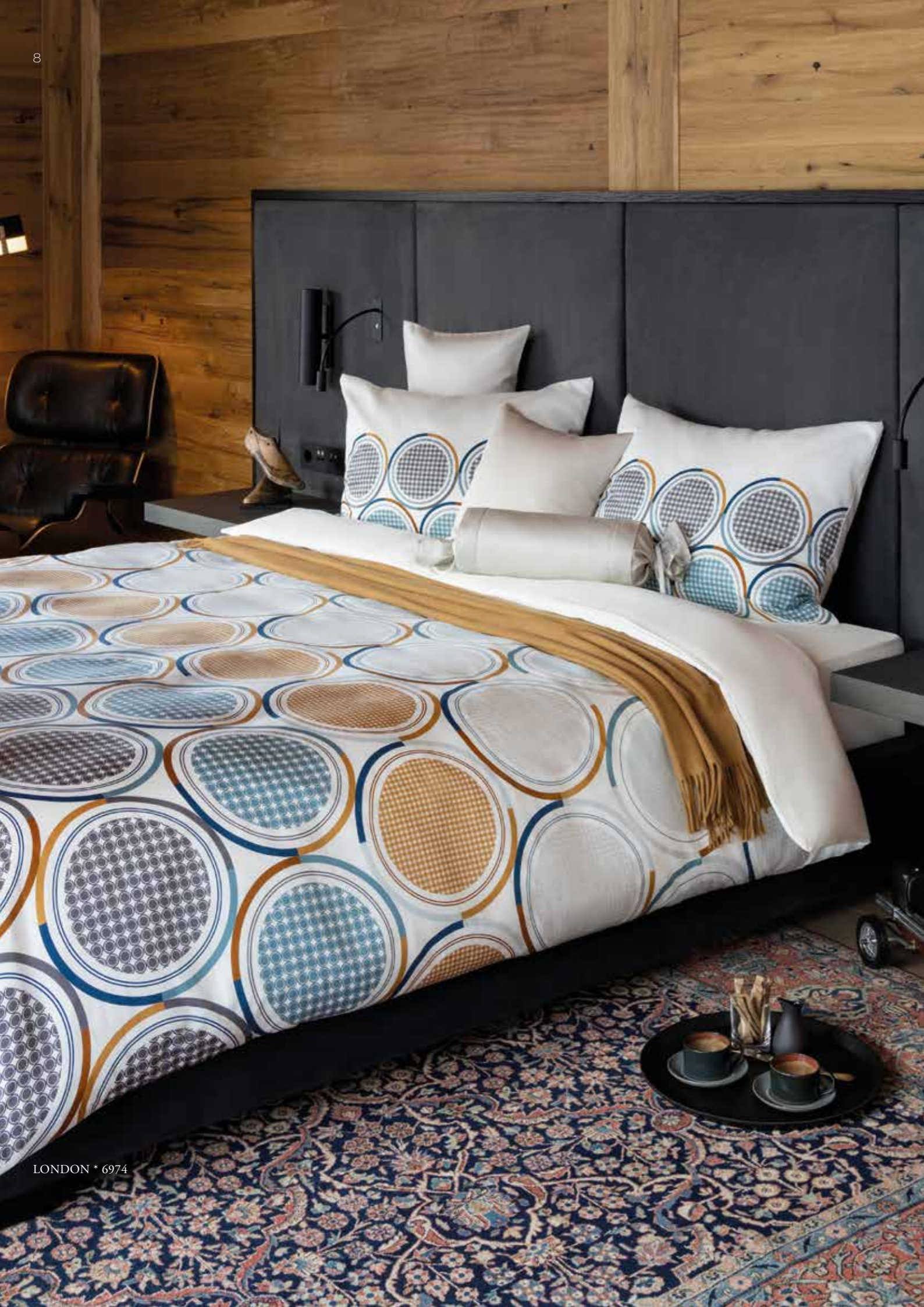
LONDON * 6974