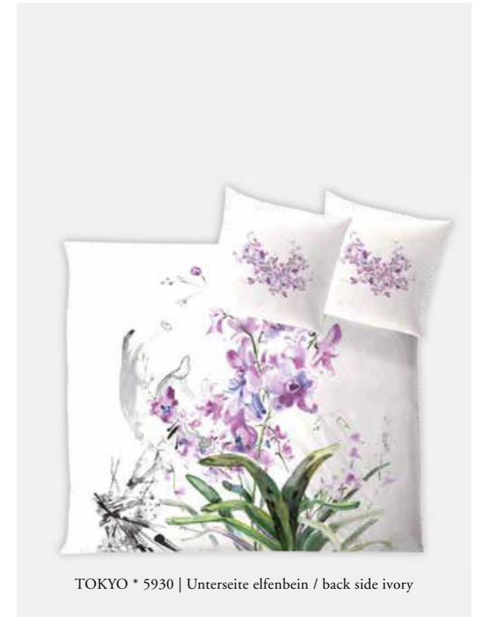
TOKYO * 5930 | Unterseite elfenbein / back side ivory