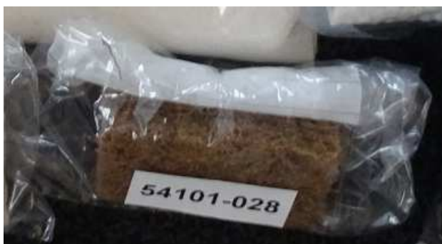
A028: Kokos von D1: Naturlatex/Latex Kokos Sandwich-Kern (A008)