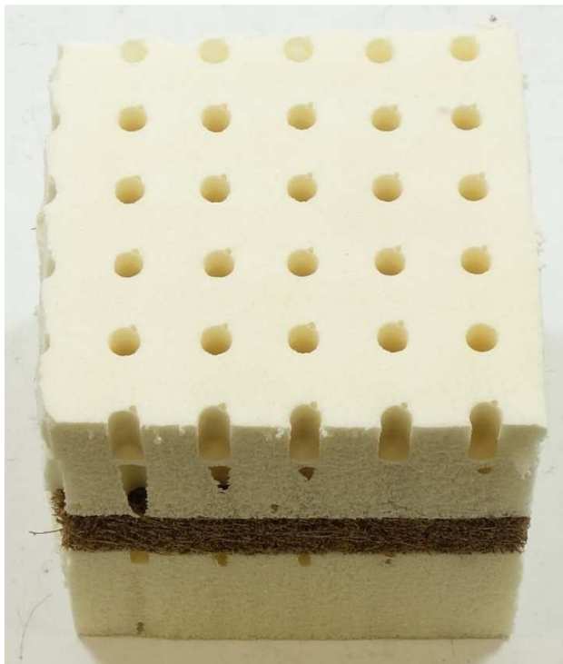
A008: D1: Naturlatex/Latex Kokos Sandwich-Kern